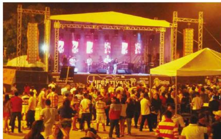
O XI Festival de Inverno da Serra da Meruoca aconteceu na Praça do Centro de Eventos

O valor dos prêmios foi de sete mil reais para o primeiro lugar; cinco mil reais para o segundo lugar e três mil para a terceira colocação. O prêmio de melhor arranjo levou mil e quinhentos reais e o melhor intérprete ganhou mil reais.