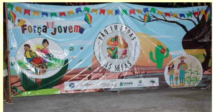
2023: Pão em todas as mesas. https://www.youtube.com/watch?v=bDcWfvh7Jjg