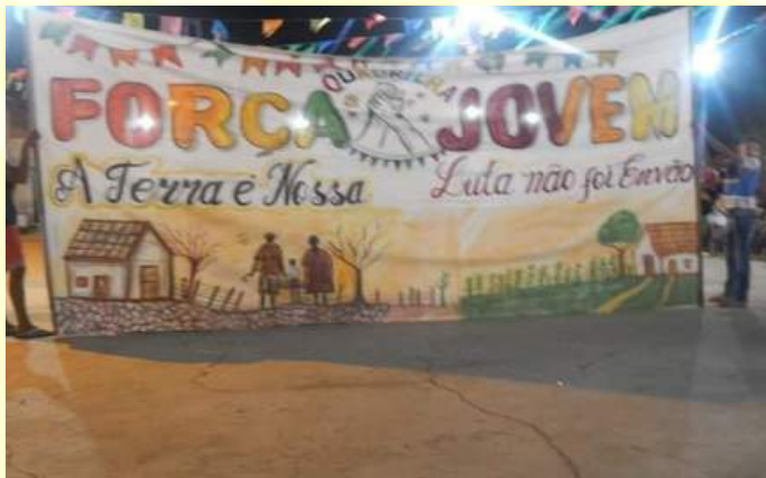
2018: A Terra é nossa. https://www.youtube.com/watch?v=99zJxH1qS0w&feature=youtu.be

Desde sua criação, o grupo traz em seu enredo temáticas voltadas à valorização da cultura, ao fortalecimento da identidade da juventude como protagonista de seu próprio destino, ao resgate histórico das Comunidades Eclesiais de Base (CEB's) e das lutas camponesas.