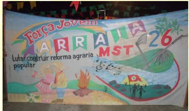
2015: MST, essa luta é pra valer https://www.facebook.com/1999036870333018/posts/pfbid02Mz4Jx7Scpydm6ziTucsWcPL2P9ZdPTD4v2oF6RZnxVAVz29avwGHZgjV6p4Lv4Pl/?mibextid=Nif5oz