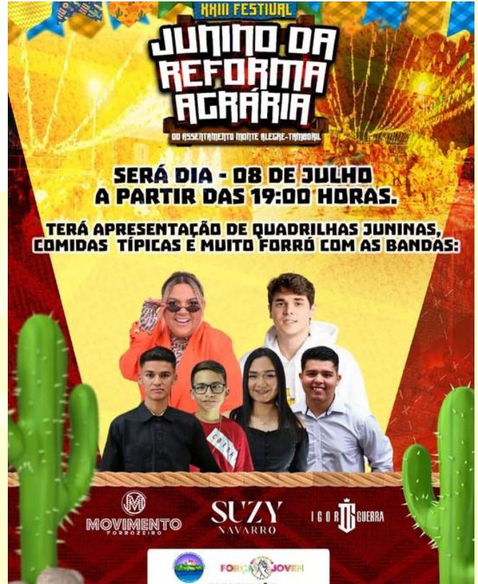
Apresentação no Festival da Reforma agrária 2017: https://www.youtube.com/watch?v=tto7O7dq yNE