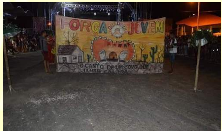
2019: O canto de um povo que jamais calará. https://www.youtube.com/watch?v=UgzbdOMQJdk&feature=youtu.be