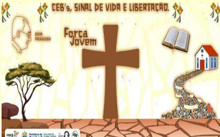
2022: CEBs Sinal de vida e libertação. https://www.youtube.com/watch?v=8ZLTy5ztqoY&feature=youtu.be