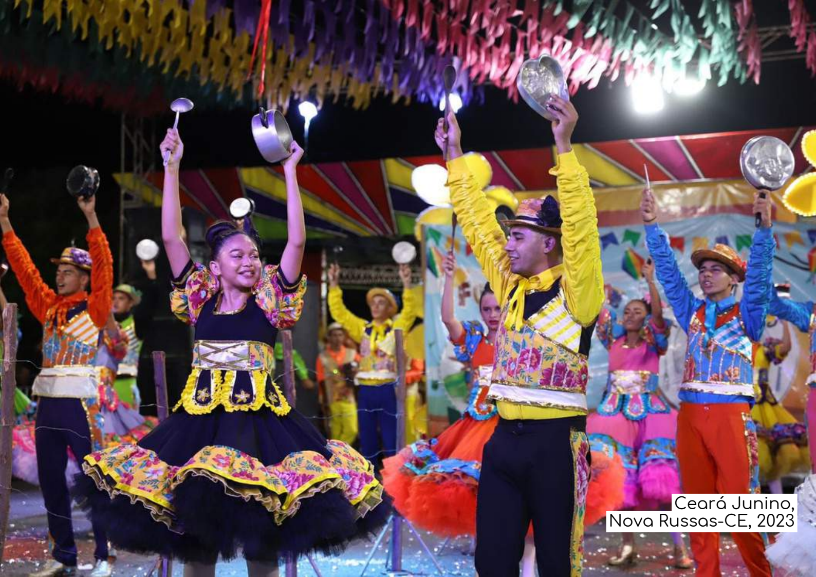
Ceará Junino, Nova Russas-CE, 2023