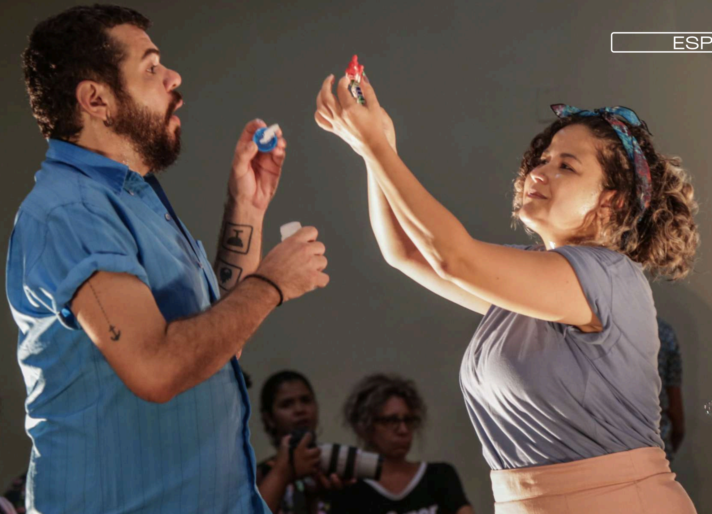
EXPRESSO SONHO AZUL (2018) - MANADA TEATRO TUTORIA: GEORGETTE FADEL