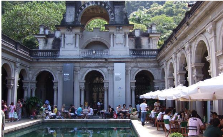
CAFÉ DA MANHÃ NO PARQUE LAJE: PROGRAMA DELICIOSO NO RIO | ANA PEYROTON