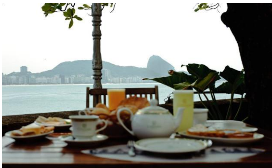
COLOMBO NO FORTE DE COPACABANA: COM VISTA PARA O MAR | RIOTUR

É outra opção de café da manhã em mais um ponto charmoso da cidade. O lado de dentro do café traz um pedaço da original e famosa Confeitaria Colombo do centro da cidade, mas a disputa mesmo é pelas mesas do lado de fora, próximas ao muro onde quebram as ondas de Copacabana. O barulho é apenas do mar e das gaivotas. O café da manhã completo é uma delícia!