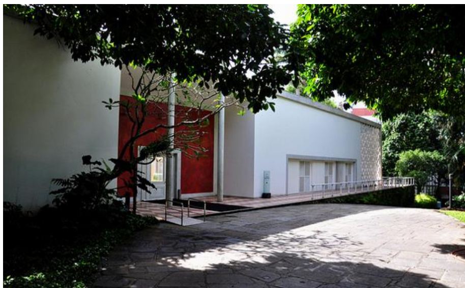
INSTITUTO MOREIRA SALES FICA NO BAIRRO DA GÁVEA

O centro cultural que fica na Gávea é composto de cinema, exposição, acervo musical e um charmoso café. A arquitetura do lugar vale a pena conferir. É a antiga casa dos Moreira Salles com jardins projetados por Burle Marx. Destaque para o acervo musical, que fica numa sala especial. Recentemente foi doado o acervo musical do Sivuca, o mestre da sanfona. Lá, existem pérolas da música nacional. A sala de cinema, pra poucas pessoas, tem sempre uma mostra especial.