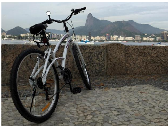
MURETA DA URCA: DICA DE PASSEIO PARA O FINAL DA TARDE

Para quem prefere um fim de tarde com uma cervejinha gelada e pastéis fritos na hora, com direito ao visual da enseada de Botafogo, a direção é a mureta da Urca. É preciso sair da ciclovia e atravessar a rua, à esquerda, em direção ao posto de gasolina e seguir margeando o calçadão da Urca, passando pelo antigo Cassino e TV Tupi. Como não existe mais ciclovia, a atenção ao trânsito deve ser redobrada.