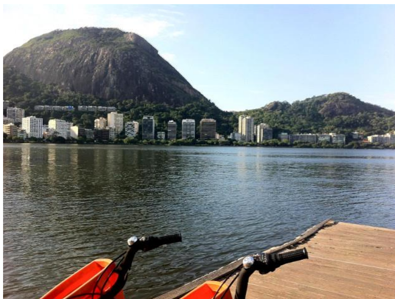
PIER NA LAGOA RODRIGO DE FREITAS

Vale a pena dar uma volta inteira pedalando na Lagoa, curtindo a deslumbrante paisagem, considerada um dos cartões-postais da cidade. São apenas 7,5 Km de pista pavimentada, mas o passeio pode ser feito de forma tranquila, parando e curtindo. Habitat natural de várias aves, a Lagoa possui píers ao redor, de onde se pode contemplar o visual. Em toda a sua extensão existem quiosques com estrutura de restaurante e cardápios variados. É na Lagoa que fica o Cinépolis Lagoon, que reúne seis salas de cinema e alguns restaurantes. A partir desta ciclovia chega-se também ao Jardim Botânico e ao Jockey Club.