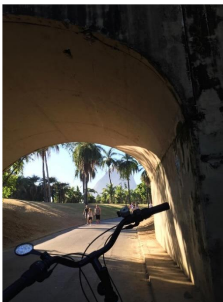
PEDALAR PELO ATERRO DO FLAMENGO É PASSEIO DELICIOSO NO RIO

Uma das delícias em andar de bicicleta pelo Aterro é ouvir o canto dos pássaros, curtir a beleza do jardim projetado por Burle Marx e sentir o cheiro da natureza. Uma das primeiras saídas, de quem vai de Botafogo para o Centro, fica próxima ao palácio do Catete, onde se pode ir ao museu, cinema ou tomar um café no jardim do palácio. Se for um domingo pela manhã, o bom é passar pela rua Paissandu, famosa pelas palmeiras imperiais, até chegar à praça São Salvador e curtir um tradicional chorinho no coreto.