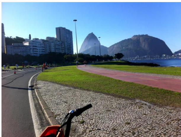
CURVA SAINDO DE BOTAFOGO EM DIREÇÃO AO ATERRO DO FLAMENGO

Se o destino for o Aterro do Flamengo, é só seguir a ciclovia. É neste momento em que se pode ver o Pão de Açúcar mais próximo e, pra completar o visual, ao olhar para o outro lado, pode-se ver o Cristo Redentor, também numa perspectiva bem próxima.