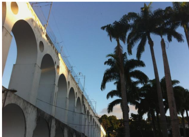
OS ARCOS DA LAPA, NO RIO