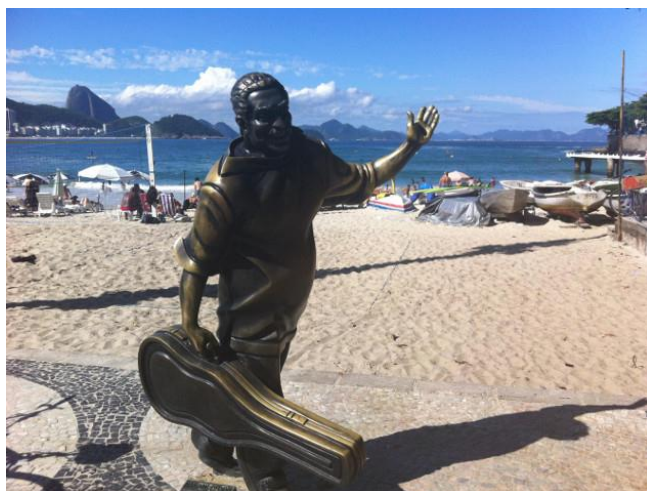
ESTÁTUA DO CANTOR E COMPOSITOR BAIANO DORIVAL CAYMMI NA PRAIA DE COPACABANA