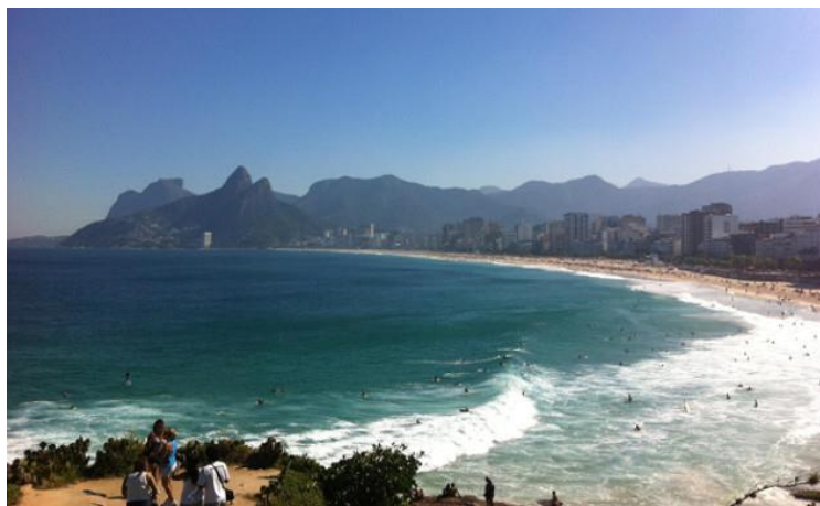
MIRANTE DO ARPOADOR COM O MORRO DOIS IRMÃOS AO FUNDO

Esta é uma das estações mais concorridas da praia, principalmente em dias de sol. Mas vale a pena dar uma parada para subir o mirante da Pedra do Arpoador, que tem a vista do morro Dois irmãos, cenário clássico do pôr do sol com a salva de palmas. De lá é possível ter ainda uma visão das praias do Diabo e de Copacabana. É neste recanto onde estão a estátua do Tom Jobim e o parque Garota de Ipanema.