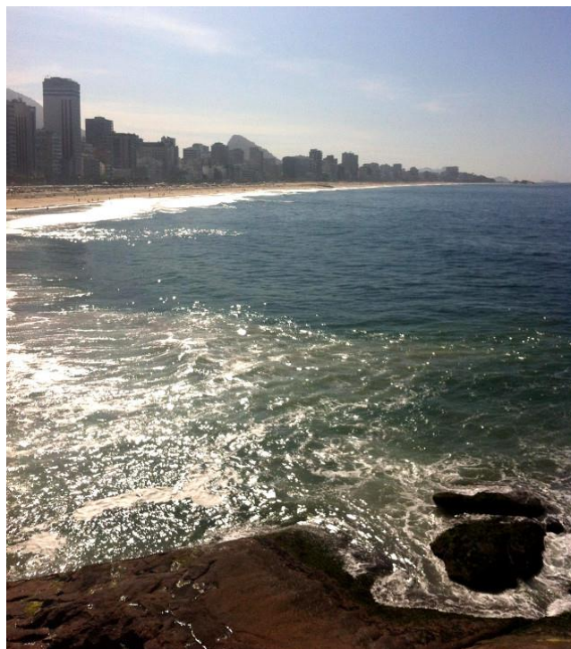
MIRANTE DO LEBLON: PARADA IMPERDÍVEL EM PASSEIO DE BICICLETA PELA CIDADE MARAVILHOSA