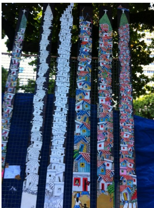
FEIRA DE IPANEMA FUNCIONA TODOS OS DOMINGOS, DAS 7H ÀS 19H

Um passeio bom no domingo pela manhã é pedalar até a Praça General Osório, conferir as novidades da Feira Hippie de Ipanema e depois tomar um café no Terzetto, que fica bem na esquina da feira, entre as ruas Visconde de Pirajá e Jangadeiros. Se preferir, é possível pedalar mais uns 5 minutos até o Forte de Copacabana e tomar o café na Confeitaria Colombo, com direito a uma vista completa das praias de Copacabana e do Leme. Próximas à entrada, no calçadão de Copa, estão as estátuas do Dorival Caymmi e Carlos Drummond de Andrade.