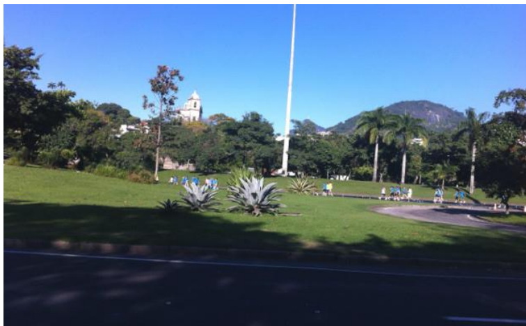
JARDINS DO ATERRO DO FLAMENGO FORAM PROJETADOS POR ROBERTO BURLE MARX