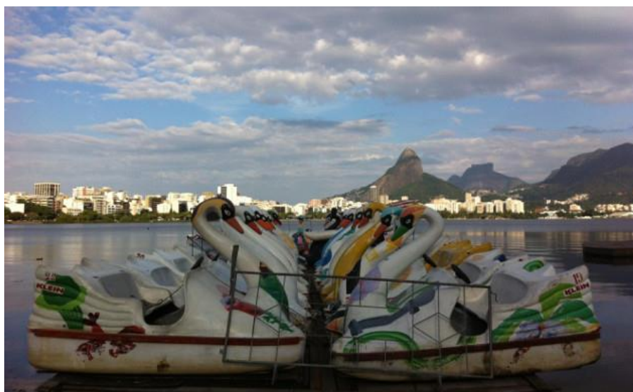
PEDALINHOS: DIVERSÃO NA LAGOA