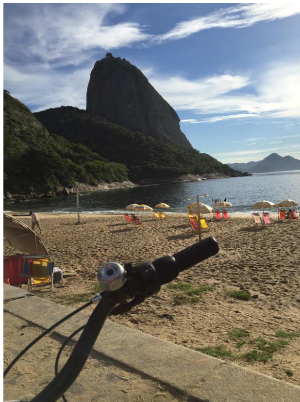
PRAIA VERMELHA FICA NO BAIRRO DA URCA, NO RIO DE JANEIRO

Seguindo para a Urca, no final da ciclovias dá para atravessar a rua em direção à praça, onde há uma estação de bicicleta de frente para a Praia Vermelha. Se quiser dar uma caminhada, a opção é a pista Claudio Coutinho, que margeia a pedra do Pão de Açúcar. Em meio a uma mata, de uma pista asfaltada, é possível ver micos; na metade da caminhada tem a trilha que sobe e dá acesso à pedra da Urca, um passeio para quem gosta de mais aventura. Se subir para ver o pôr do sol, há a opção de descer de bondinho de graça, depois das 19 horas.