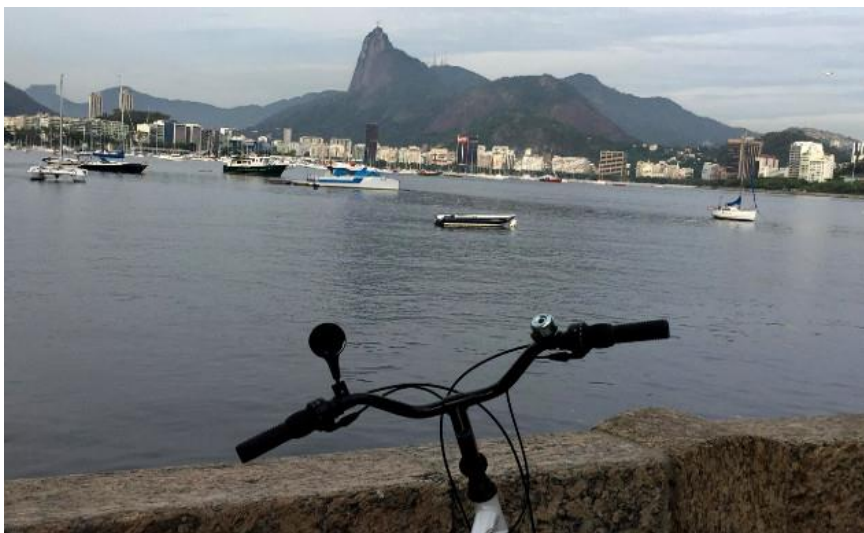
PEDALAR TENDO COMO CENÁRIO O RIO DE JANEIRO E SUAS BELEZAS NATURAIS É UMA EXPERIÊNCIA INCRÍVEL

Andar de bicicleta nos abre a possibilidade de traçar novos rumos, de exercitar o corpo e relaxar a mente. E pedalar tendo como cenário o Rio e suas belezas naturais acaba sendo mais um estímulo, somado à ciclovias que interliga diversos pontos da cidade, proporcionando mais segurança no deslocamento.