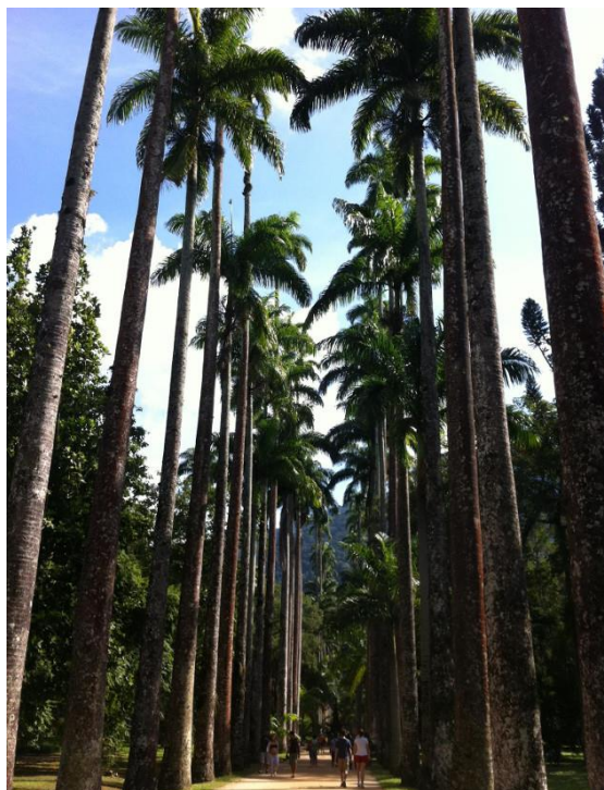
JARDIM BOTÂNICO, NO RIO DE JANEIRO