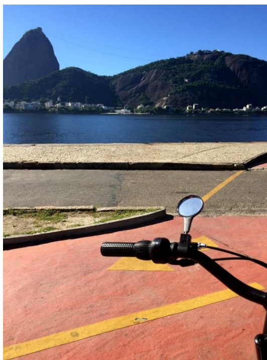
COCLOVIA NO ATERRO DO FLAMENGO

No final do Aterro, antes de chegar ao aeroporto Santos Dumont, está localizado o Museu de Arte Moderna, mais conhecido como MAM. Em frente ao museu há sinais de trânsito que permitem ao ciclista atravessar com segurança até o outro lado da avenida e parar na estação da Cinelândia. Da praça pode se avistar o Theatro Municipal, caminhar em direção à Lapa e curtir as mais variadas programações da região. Um programa diurno legal, que acontece no primeiro sábado de cada mês, é a Feira do Lavradio.