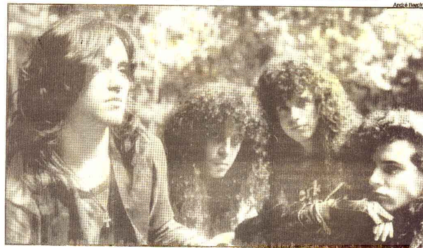
A banda de hard rock X-Rated está a partir das 13 horas, na rádio Fluminense FM, falando do novo disco

A banda esteve na terça-feira passada no estúdio da Rádio Fluminense FM, onde bateu um papo com as produtoras do Fluminense News, Isabel Flores e Ana Peyroton. O resultado da conversa pode ser ouvido hoje, a partir das 13 horas, no Fluminense News.