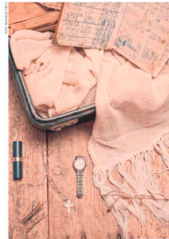
O ser feminino também é abordado de forma mais íntima na exposição