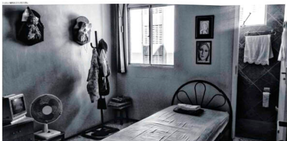
A exposição "Sol para Mulheres" reúne, a partir de amanhã (18), na Imagem Brasil Galeria, fotografias de 26 artistas que contam o viver feminino no mundo sob diversas perspectivas