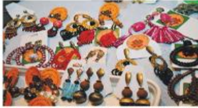
Peças coloridas para o verão amazônico estão entre as opções das feiras