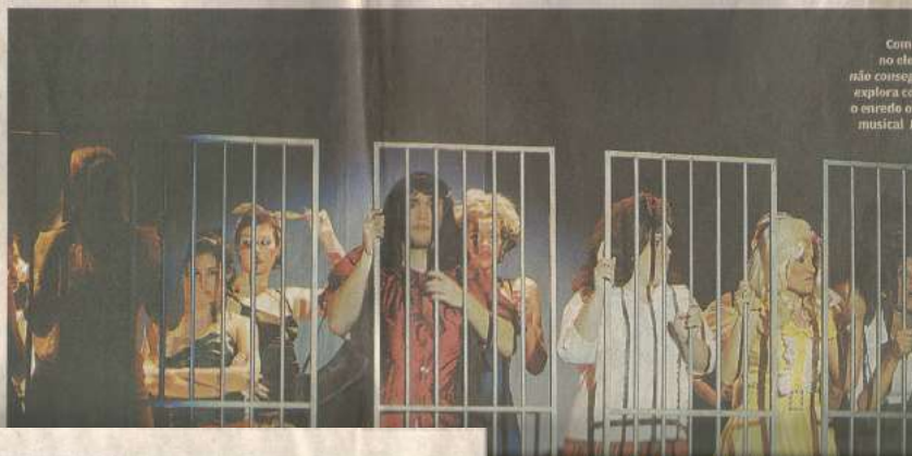
Com o elenco não consegue parar! Explora o mundo musical

ana da cidade de Baltimore. Turnsonha com a mãe e a adolescente Coltrane. O grupo musical Hairspray ganha o mundo da adolescência e chega aos