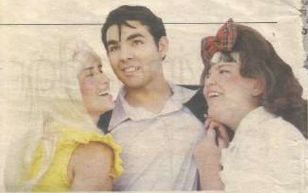
ÁS DE OURO apresenta musical inspirado em "Hairspray"

FORTALEZA, CEARÁ SEXTA-FEIRA, 9 DE OUTUBRO DE 2009