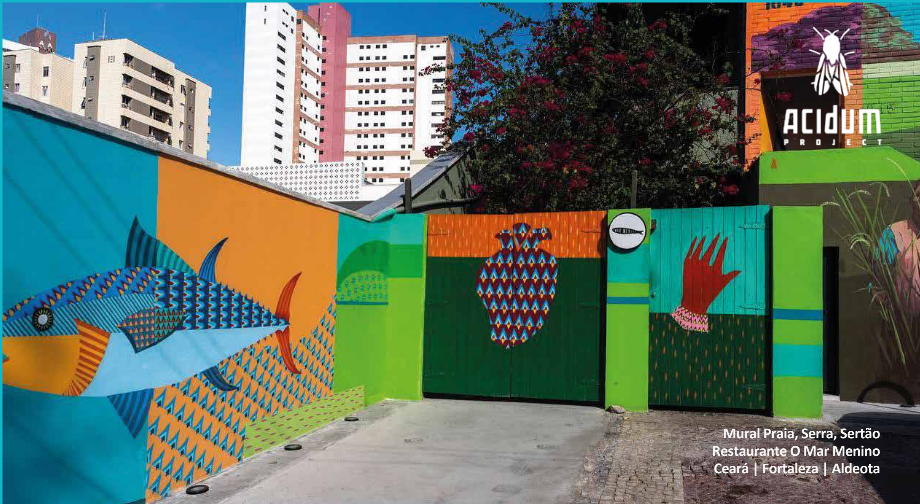
Mural Praia, Serra, Sertão Restaurante O Mar Menino Ceará | Fortaleza | Aldeota