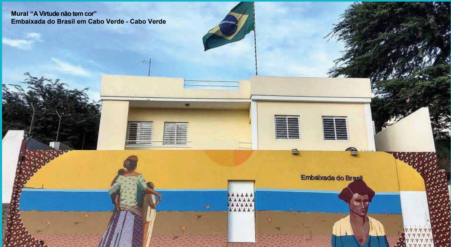
Mural “A Virtude não tem cor” Embaixada do Brasil em Cabo Verde - Cabo Verde