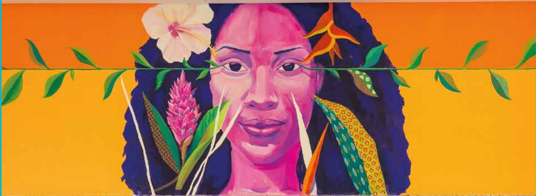
Mural "Tropical Natural" Aeroporto Internacional do Galeão - Rio de Janeiro.