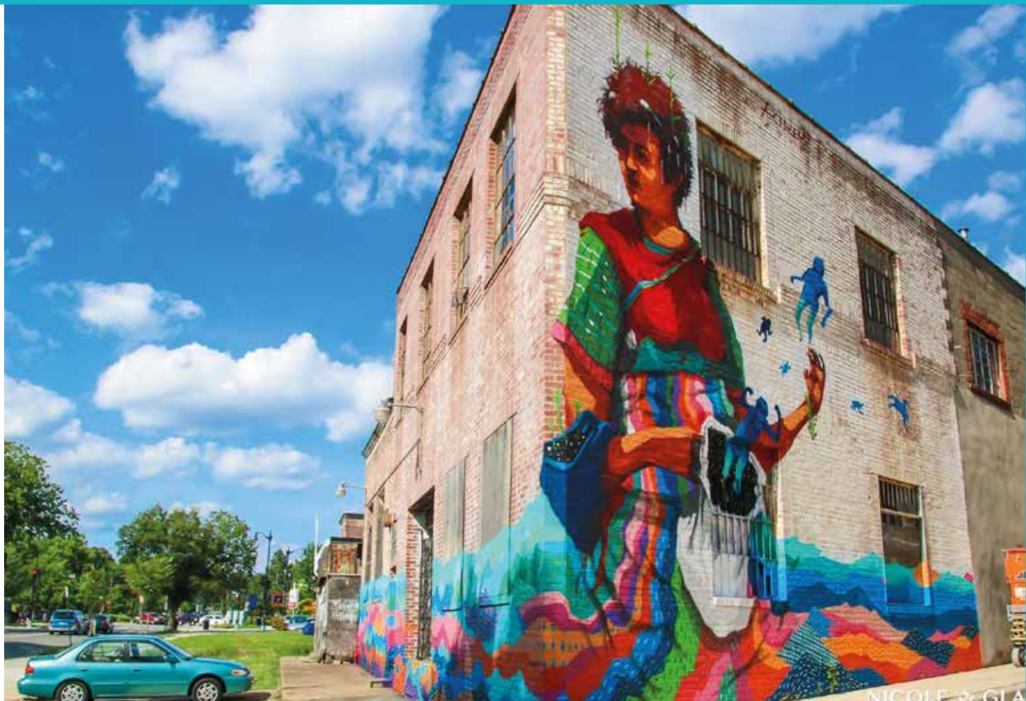
Mural "Senhora dos Tempos" Washington - DC | 2016