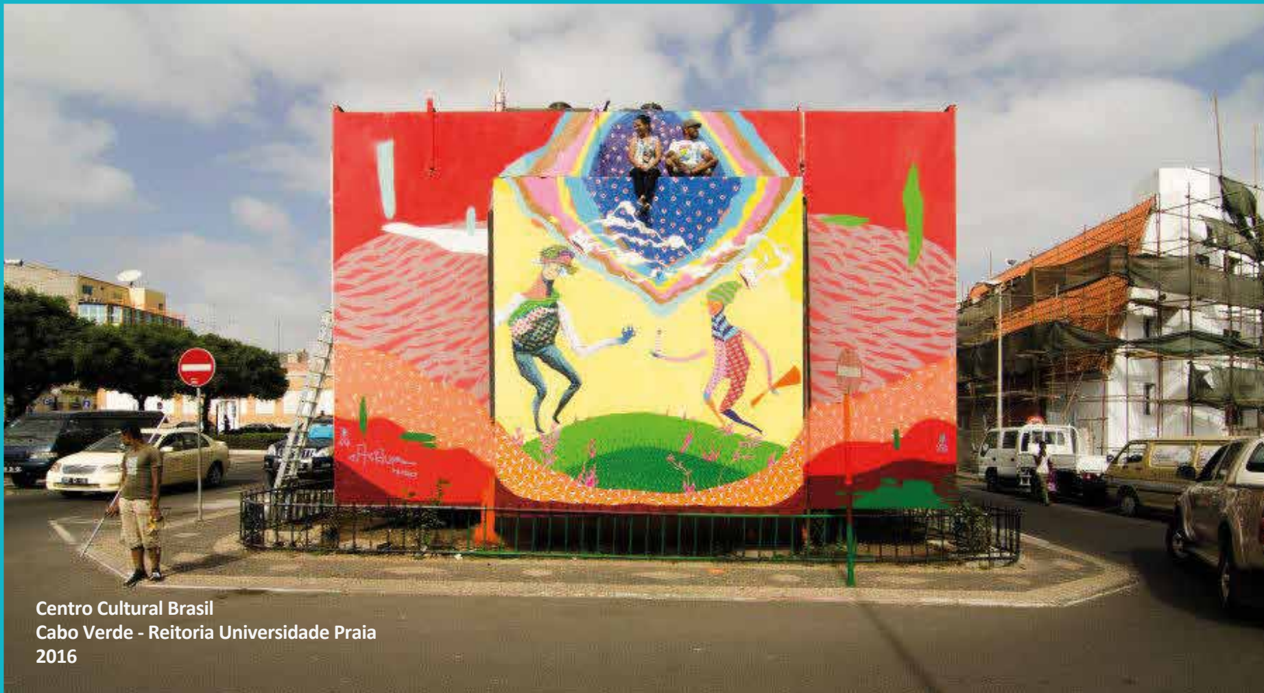
Centro Cultural Brasil Cabo Verde - Reitoria Universidade Praia 2016