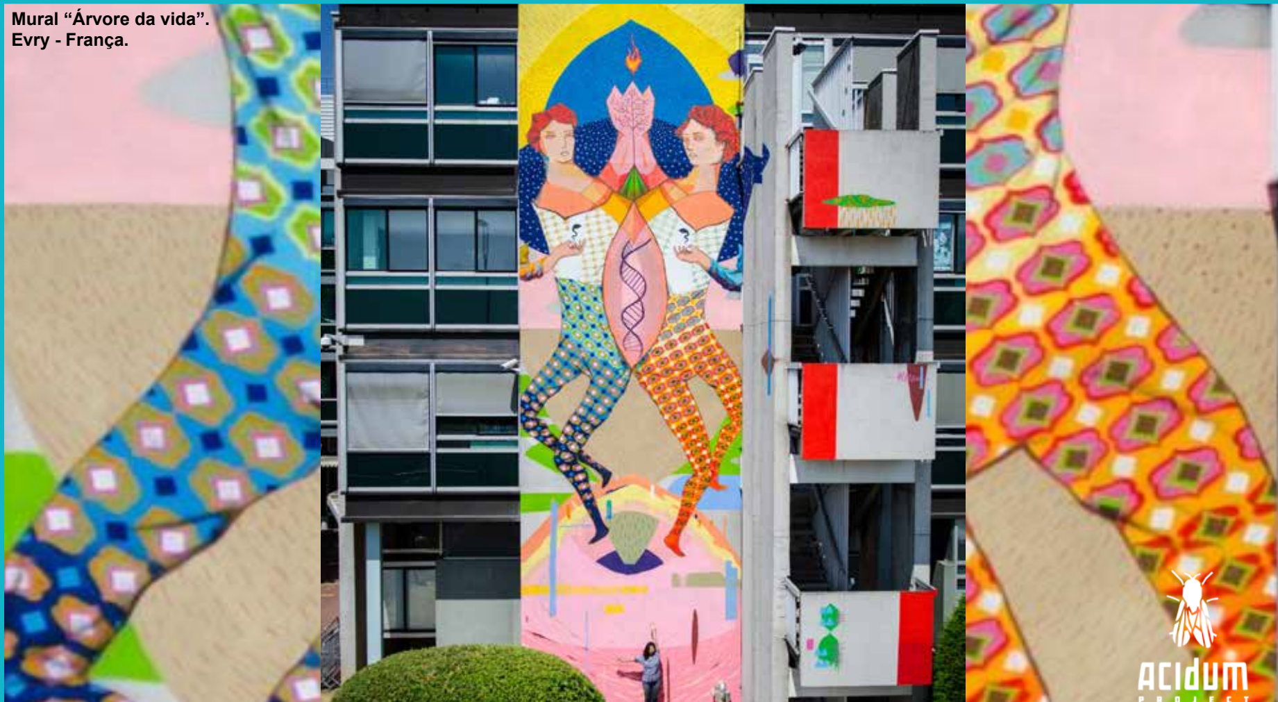
Mural "Árvore da vida". Evry - França.