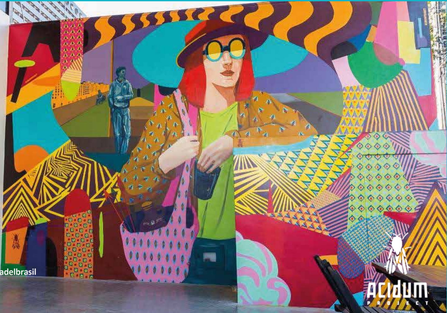
Mural Dimensões no @donadelbrasil Fortaleza 2018