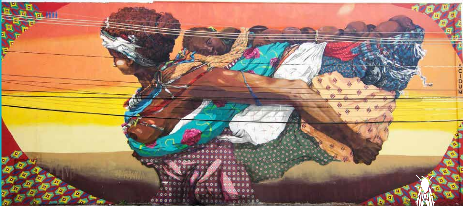
Mural Eva Fortaleza