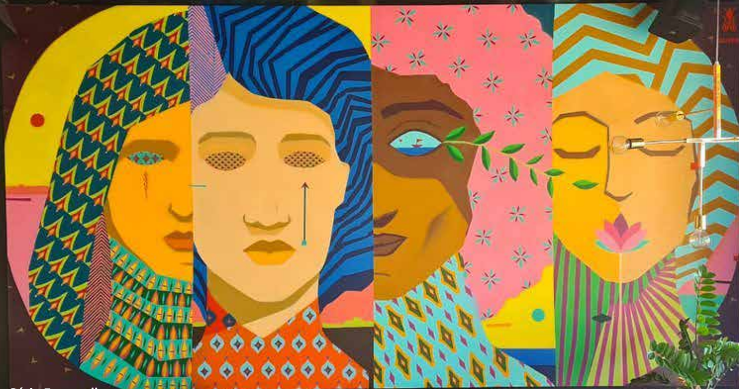
Obra #indoor da Série Facewall Coleção particular dos queridos @rafaelmagal e @natashabrigido Fortaleza 2019