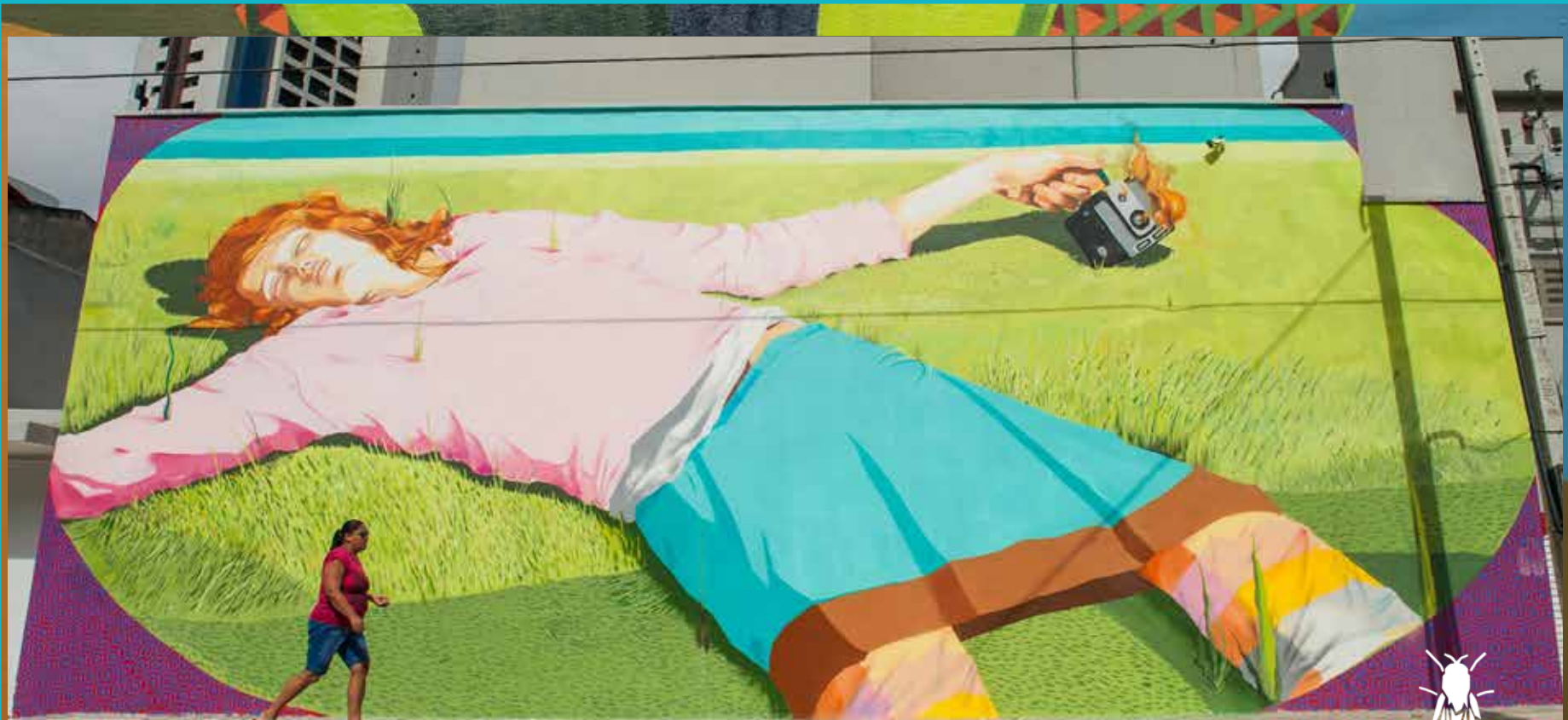
Mural Pandora Fortaleza