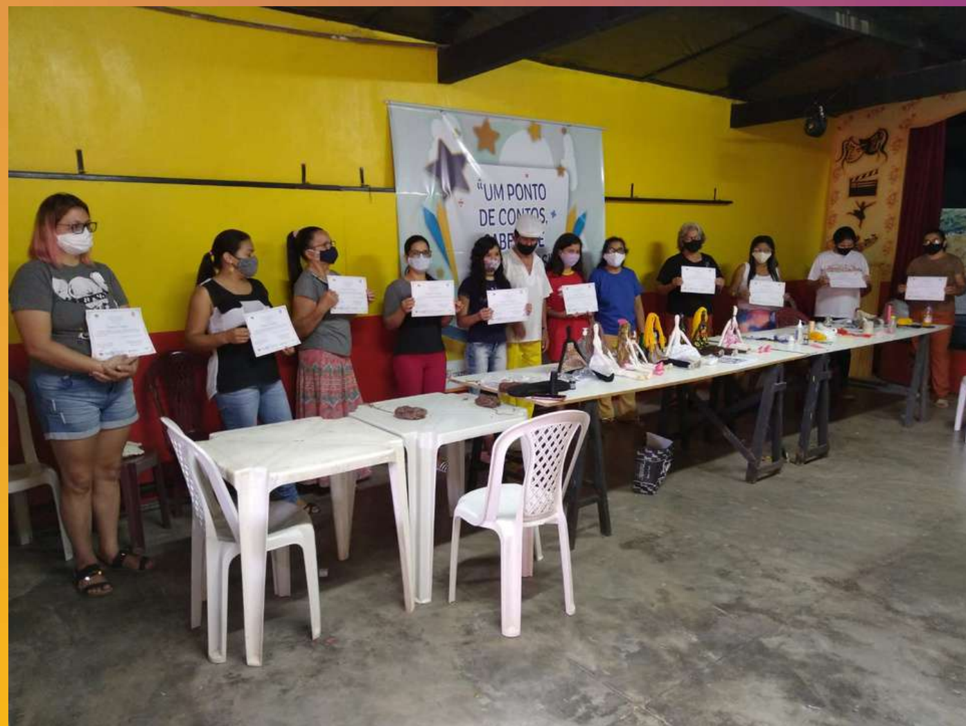
Oficina de Bonecas de Pano Parceria com o Ponto de Cultura Arte na Praça Guaraciaba do Norte - 2021