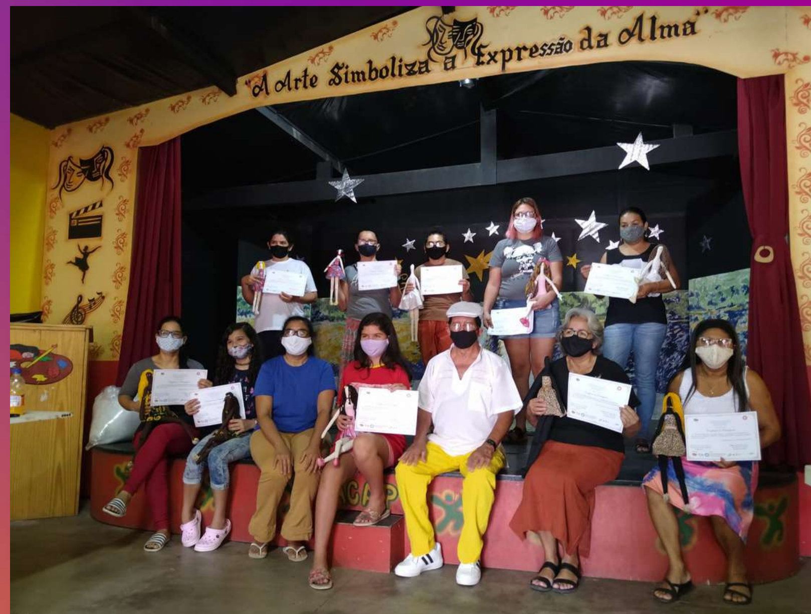
O museu oferece, regularmente, oficinas, em seu próprio espaço ou em espaços de parceiros