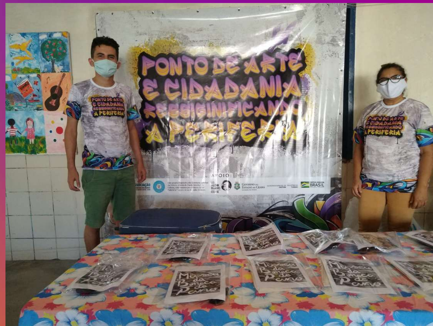
Oficina de Boneca de Pano na Associação Comunitária dos Bairros Ellery e Monte Castelo - 2021 Ponto de Arte e Cidadania Ressignificando a Periferia