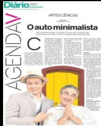
Matéria “Auto do Cumpade Cido” Diário do Nordeste