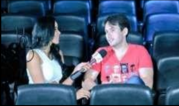
Programa Se Liga TV Verdes Mares (Globo-CE)