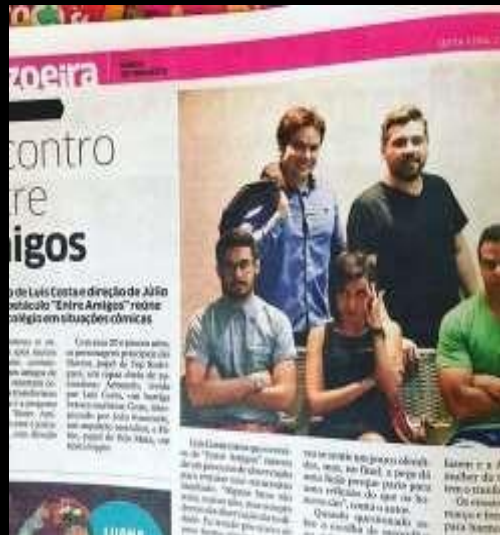
Matéria “Entre amigos” Diário do Nordeste