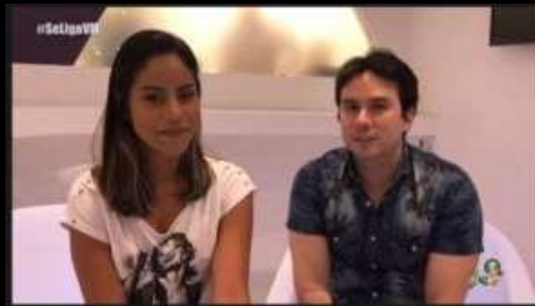
Entrevista “Enfim, nós” TV Verdes Mares (Globo-CE)