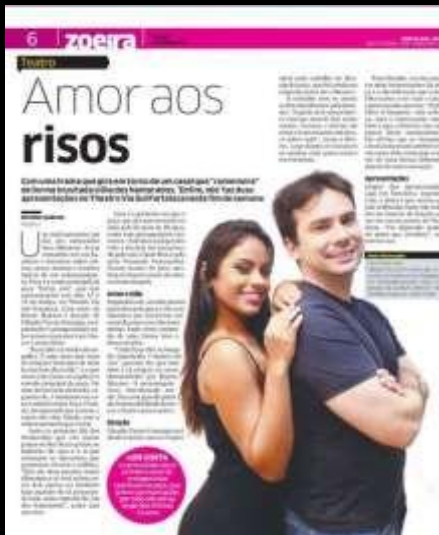
Matéria “Enfim, nós” Diário do Nordeste