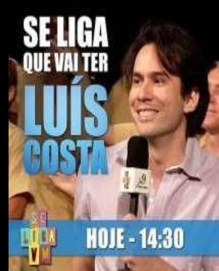
Chamada de entrevista TV Verdes Mares