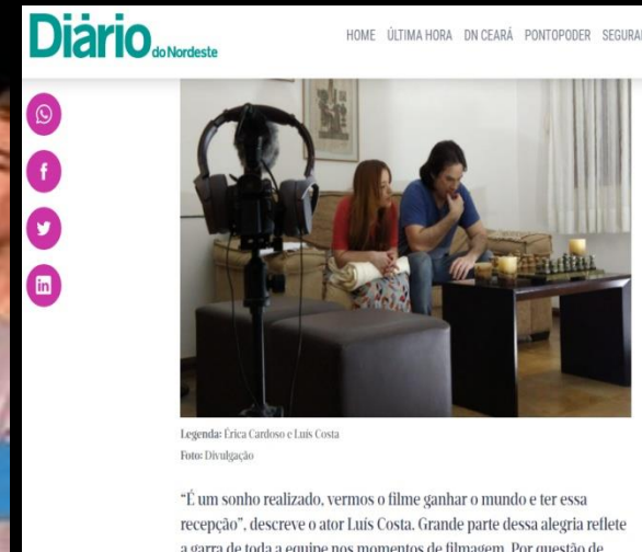
Matéria “Entrelaçados” Diário do Nordeste