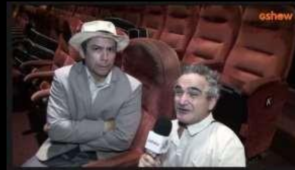
Entrevista “Auto do Cumpade Cido” Site Gshow