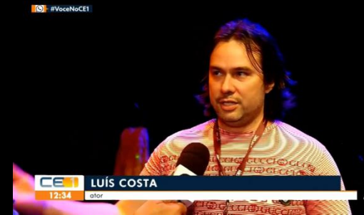
Entrevista CETV TV Verdes Mares (Globo-CE)