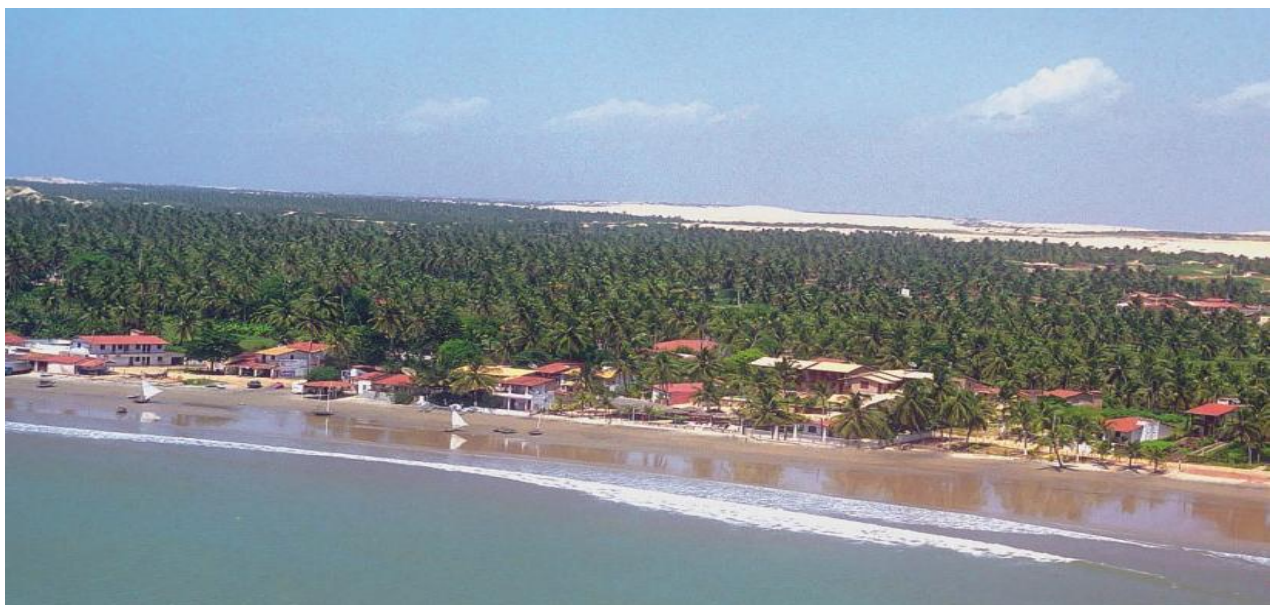
Figura 2 - Vista aérea da Praia de Flecheiras no Município de Trairi - Ce

Esta praia caracteriza-se por apresentar uma extensa formação recifal do tipo franja ou margem, exposta somente na maré baixa e alinhada paralela a orientação geral da costa, medindo aproximadamente 1,5km de extensão e largura variando entre 50 a 80m (Figuras 2 e 3)