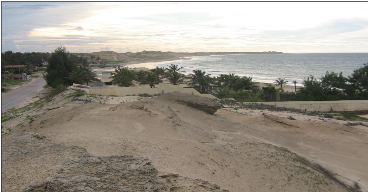
Figura 4 - Vista das dunas da Praia de Embuaca, Município de Trairi – Ce.

Segundo SILVA (1987), dos nove tipos climáticos da Classificação de Thornrthwaite, sete são identificados no Estado do Ceará, variando do tipo úmido ao tipo árido, e a baixa precipitação aliada a elevada evapotranspiração potencial, em consequência das elevadas temperaturas, impõe a predominância do tipo climático semi-árido. A região norte do Estado, onde a praia de Embuaca localiza-se, caracteriza-se por um clima que varia do tipo sub-úmido ao semi-árido, sendo que nas proximidades da cidade de Trairi, no litoral ocidental, merece destaque uma mancha úmida delimitada pela isoietas de 1500mm, onde a incidência de totais pluviométricos são mais elevados (SILVA, 1985). Para os anos de 1991 e 1992, porém foram registrados respectivamente no Município de Trairi, índices pluviométricos de 765,3mm e 1381,5mm (IBGE, 1990/92).