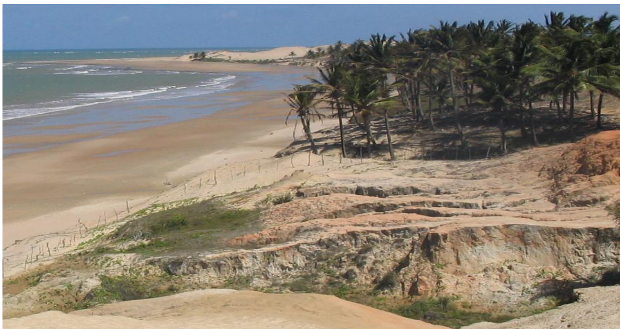
Figura 3 - Vista da Praia de Mundaú no Município de Trairi – Ce.

O campo algológico escolhido, formado por um recife de arenito – ferruginoso, de consistência dura, e conseqüentemente propício à fixação de grandes quantidades de algas, permitindo o estabelecimento de uma comunidade bentônica expressiva, apresenta extremamente entrecortado, irregular e com pouca declividade, o mesmo fica rapidamente submerso, permanecendo emerso somente durante as marés muito baixas. Na extensão deste campo formam-se esparças elevações e inúmeras depressões de diferentes dimensões que são desde pequenas poças até verdadeiras piscinas, e algumas chegam a medir em torno de 15 a 20 metros de extensão, com profundidade média de aproximadamente de 1 metro.