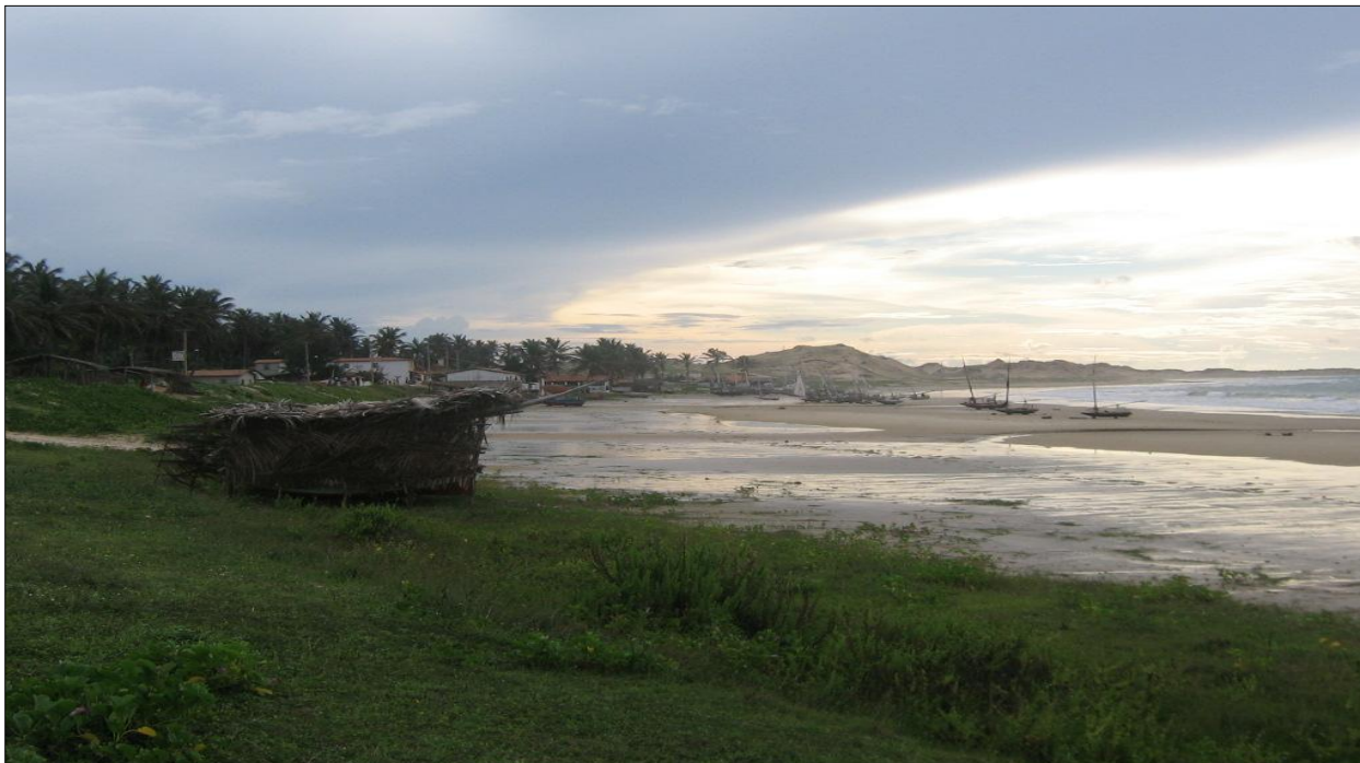
Figura 5 – Praia de Embuaca onde foram realizadas as coletas.