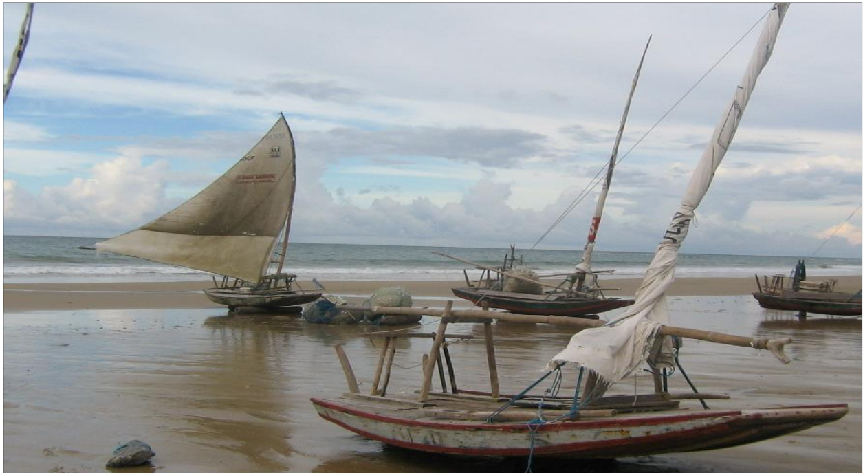
Figura 1 - Vista da praia de Embuaca no Município de Trairi – Ce.

A praia de Embuaca, região onde o presente estudo foi realizado, localiza-se no litoral oeste do Estado do Ceará, no Município de Trairi e limita-se com as praias de Flecheiras e Mundaú, distante cerca de 140km do Município de Fortaleza (Figura 1).