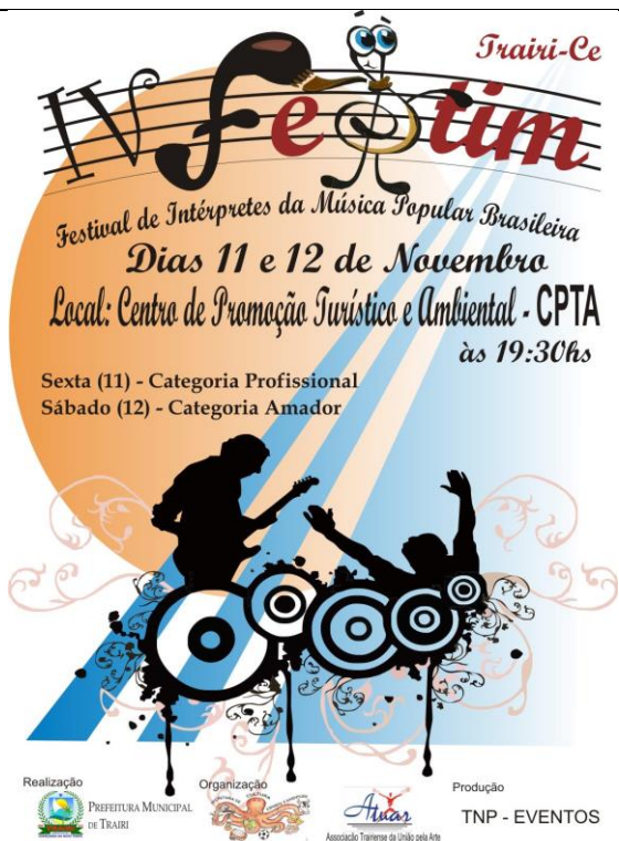
IV FESTIM- Festival de Interpretes da Musica Popular Brasileira – Realização ATUAR (2011)