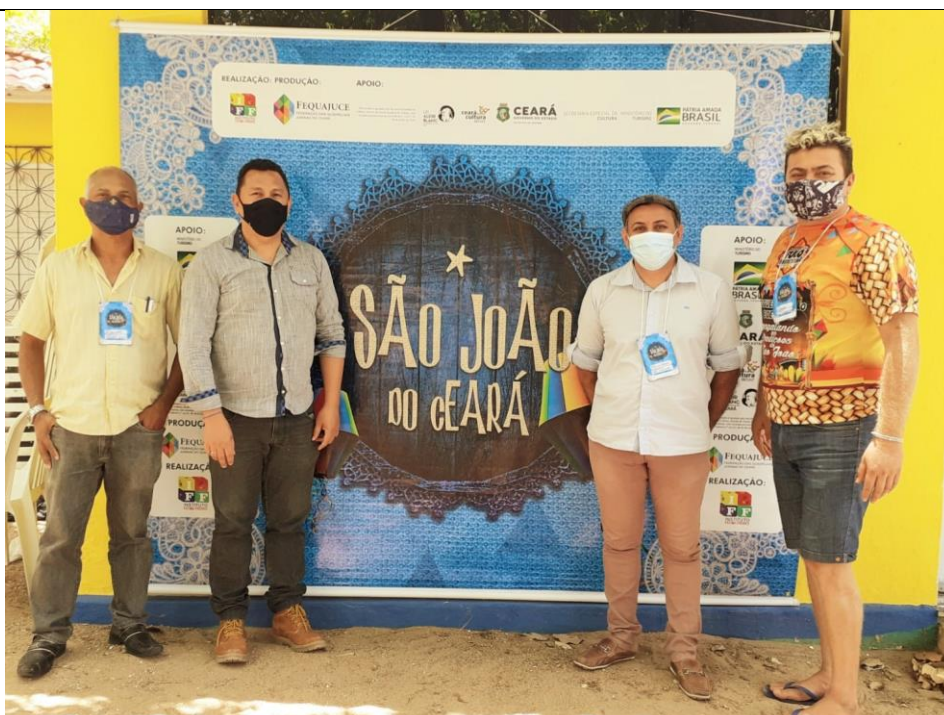
Encontro Regional do Movimento Junino em Itapipoca – Ce (2021)