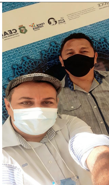
Encontro Regional do Movimento Junino em Itapipoca – Ce (2021)