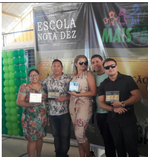
Premiação Escola Nota 10 – A Escola Eliseu Eli Barbosa recebia pela primeira vez em décadas um premio de excelência no Ensino (2017)