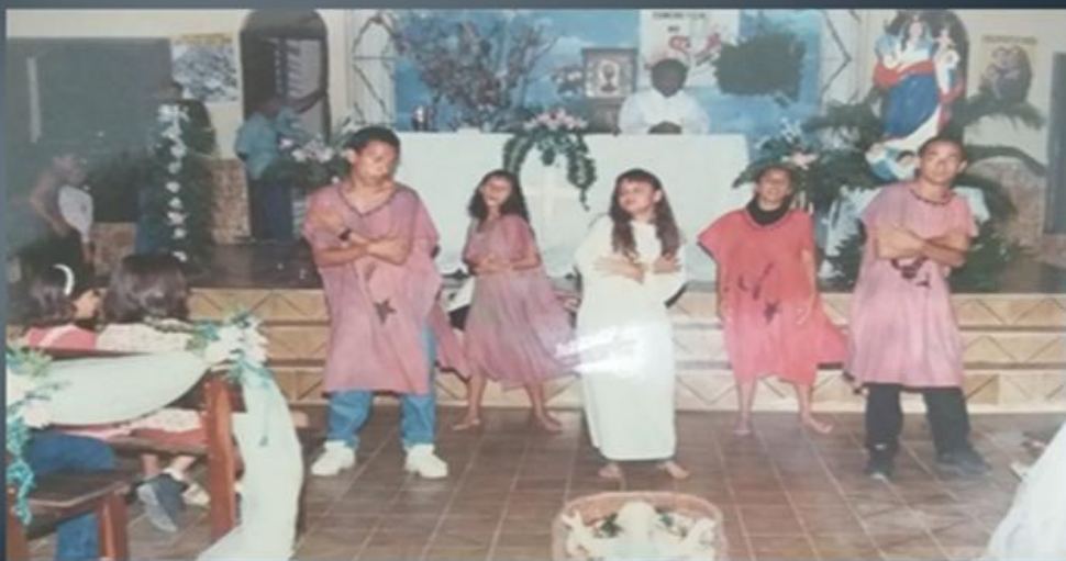
Apresentação de auto de natal na Igreja Nossa Senhora do Livramento (1994)