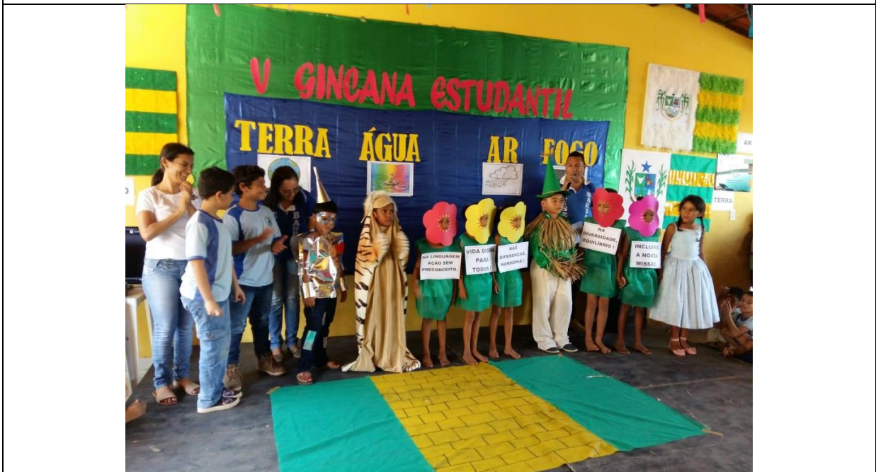
Gincana Cultural na Escola de Ensino Fundamental Eliseu Eli Barbosa (2018)