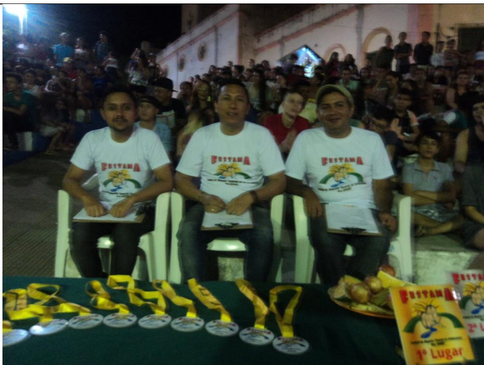
Participação como jurado, no Festival de Teatro Amador de Uruburetama – FESTAMA (2016).