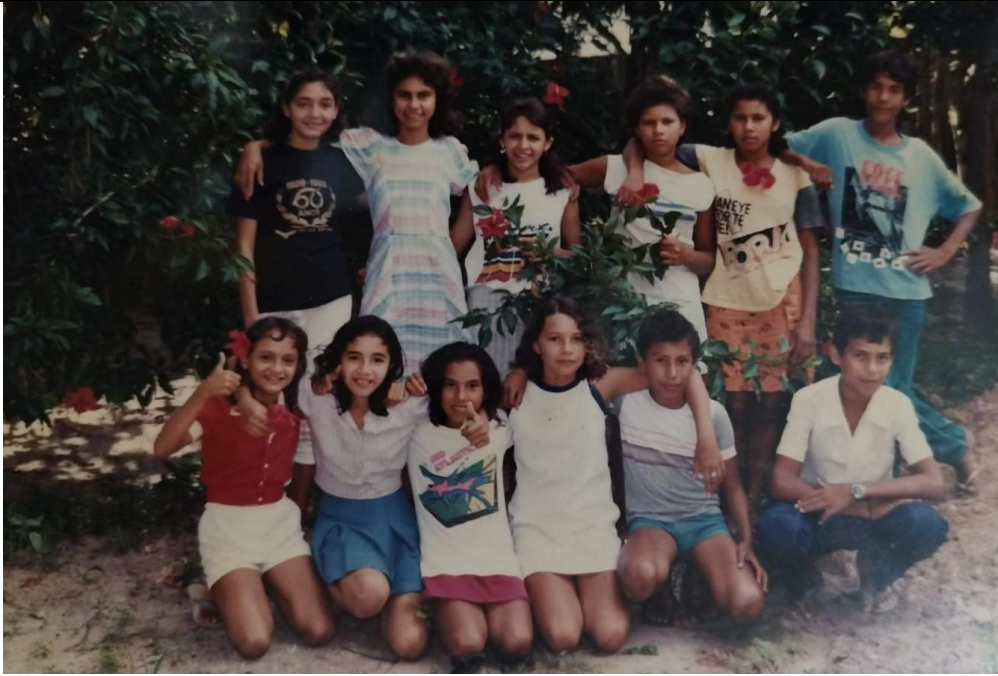
Grupo da PAC – Pastoral de Adolescentes e Crianças do município de Trairi (1988)