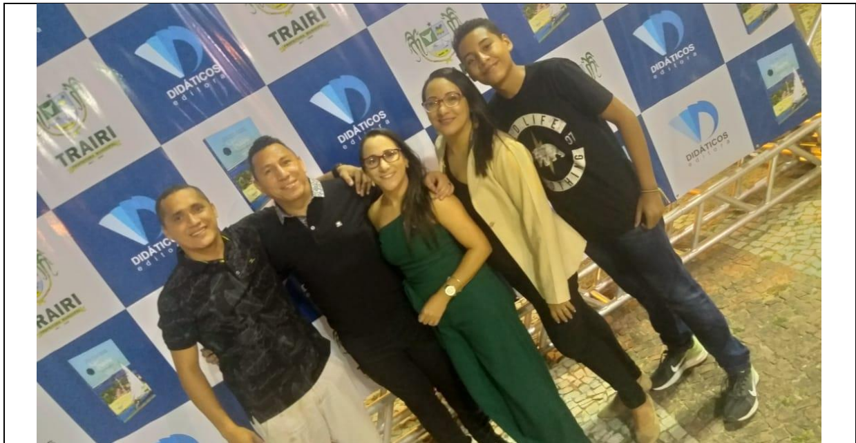
Lançamento do Livro Didático de Historia Regional: "Trairi – Cidade da gente" na Praça dos Mártires, Trairi- Ce – Autor: Juscelino Santos (2018)