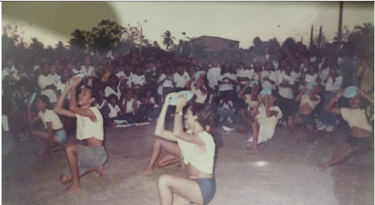
Coreografia É... a gente quer viver a liberdade! (Gonzaguinha) durante a Gincana da Escola Raimundo Nonato Ribeiro na Praça da matriz do município de Trairi- Ce (1995)