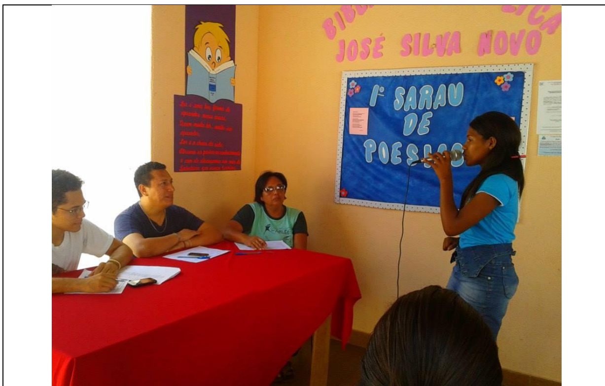
Realização de Sarau de Poesias na Biblioteca Municipal de Trairi Professor José Silva Novo ( 2013)