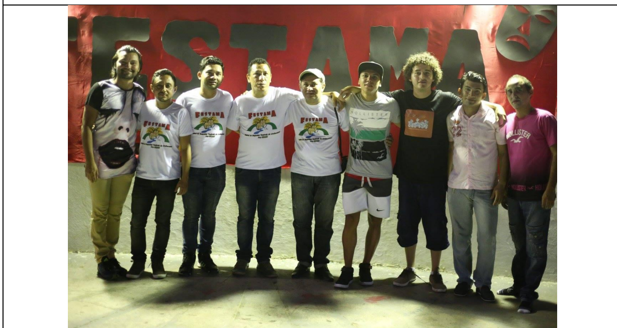
Participação como jurado, no Festival de Teatro Amador de Uruburetama – FESTAMA (2016)