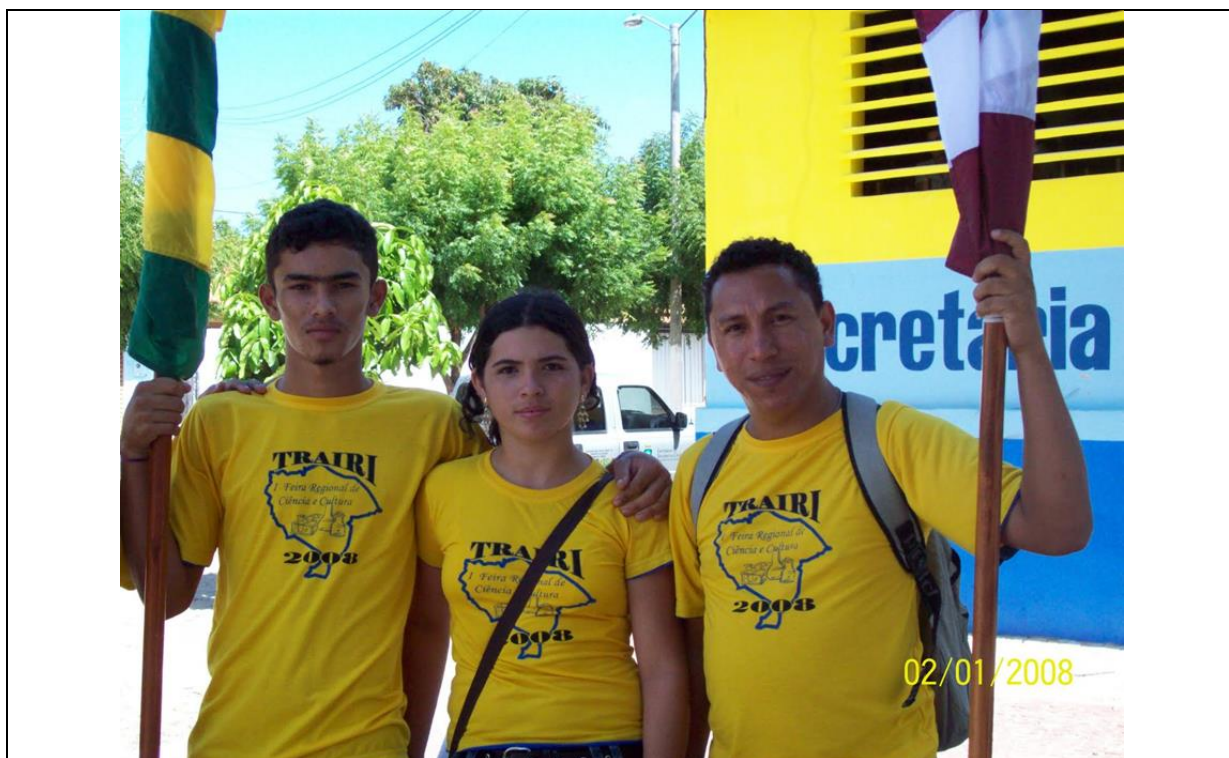
Feira Regional de Ciência das Escolas Públicas do Ceará, premiação do projeto: O assentamento de Batalha e o processo de desenvolvimento rural sustentável com alunos da Escola de Ensino Médio Maria Celeste de Azevedo Porto (2008).