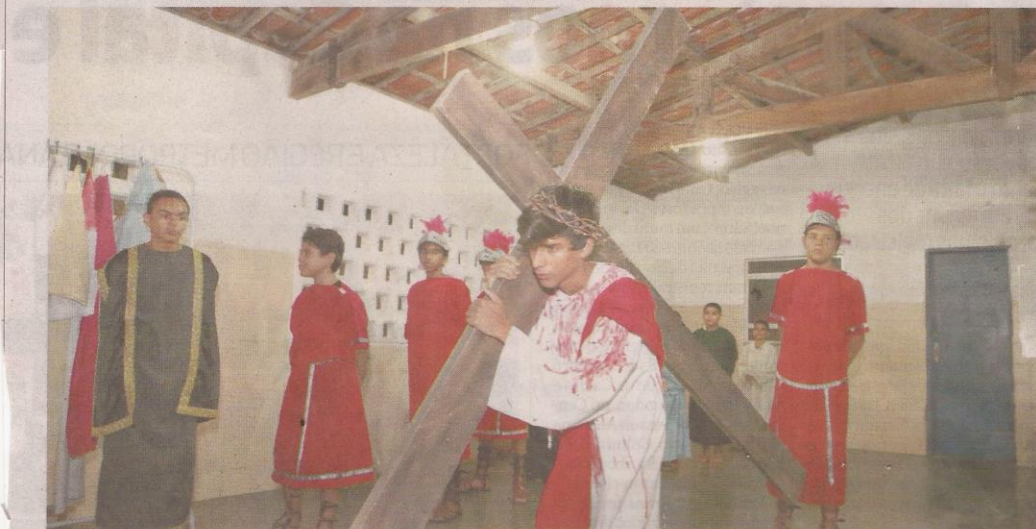
A Sexta-Feira Santa é o único dia do ano que a Igreja Católica não celebra missas. Na data, a crucificação de Jesus é encenada em vias públicas