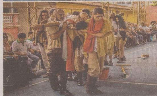
Paixão de Cristo da Cia. Teatral Acontece: grupo adapta narrativa religiosa para a linguagem do teatro de rua

das). O evento simboliza a morte de Judas Iscariotes, considerado o traidor de Jesus. Em seu terceiro ano em Fortaleza, o Festival de Malhação do Judas já faz parte da história da comunidade Vila Brasília, do bairro Jardim América. "O festival vem para falar um pouco da cultura daqui, dos meus pais. Desde a criação da comunidade, que tem essa tradição forte de fazer os bonecos de Judas. Tem família que no ano tira uns 3.400 reais de