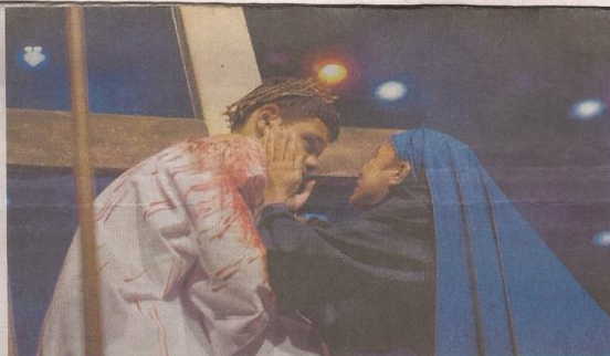
Paixão de Cristo do Sagrada Família, do bairro Ellery: grupo nasceu em julho de 2005 e agrega mais de 100 jovens da comunidade