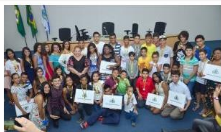
Sessão solene em alusão aos 10 anos do Grupo Juvenil Sagrada Família – Foto: André Lima.

👤 Nicolau de Araújo 🕒 26 outubro, 2017 🗨️ No Comments