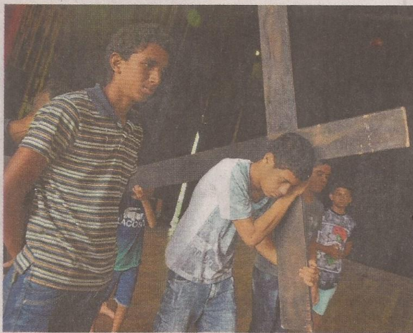
A encenação inclui 40 crianças e adolescentes do bairro Ellery. O grupo completa 11 anos e conta com o apoio de membros da comunidade.

"No começo, todos nós éramos muito jovens, e todo mundo achava lindo as crianças pequenas fazendo o teatro. Aí nós crescemos, fomos nos empolgando e outras pessoas se sentiram motivadas a participar também, ajudando com as roupas, com os