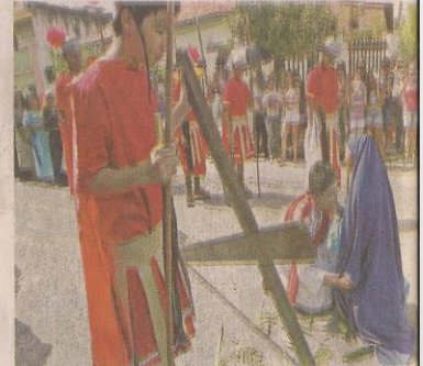
As crianças se empenharam muito nos ensaios para fazer o melhor durante o espetáculo, que envolveu boa parte dos moradores do bairro

católica e para prestigiar seu neto, que interpretou Jesus. "Gostei muito dele participar do evento, pois mostra que ele está no caminho certo", afirmou.