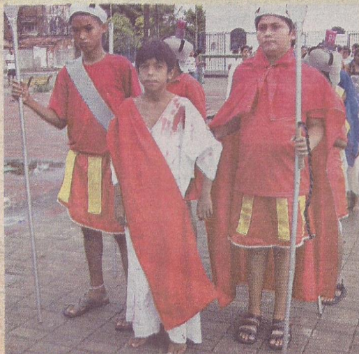
PAIXÃO DE Cristo: sucesso com elenco infantil

Segundo ele, além da encenação, o objetivo do espetáculo é abordar a Campanha da Fraternidade 2009 (Fraternidade e Segurança Pública). "Em cada estação chamaremos a atenção da platéia para os problemas de violência contra a mulher, criança e idosos. Enviamos convites para várias autoridades virem assistir e na oportunidade exporem algumas soluções para essa problemática", ressalta.