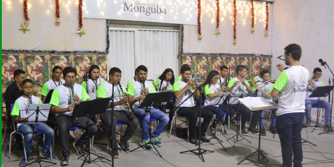
Banda de música Sons da Aratanha (2016-2020) Membros atualmente: 25 músicos