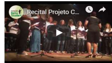
Recital Projeto Cultivando Talentos