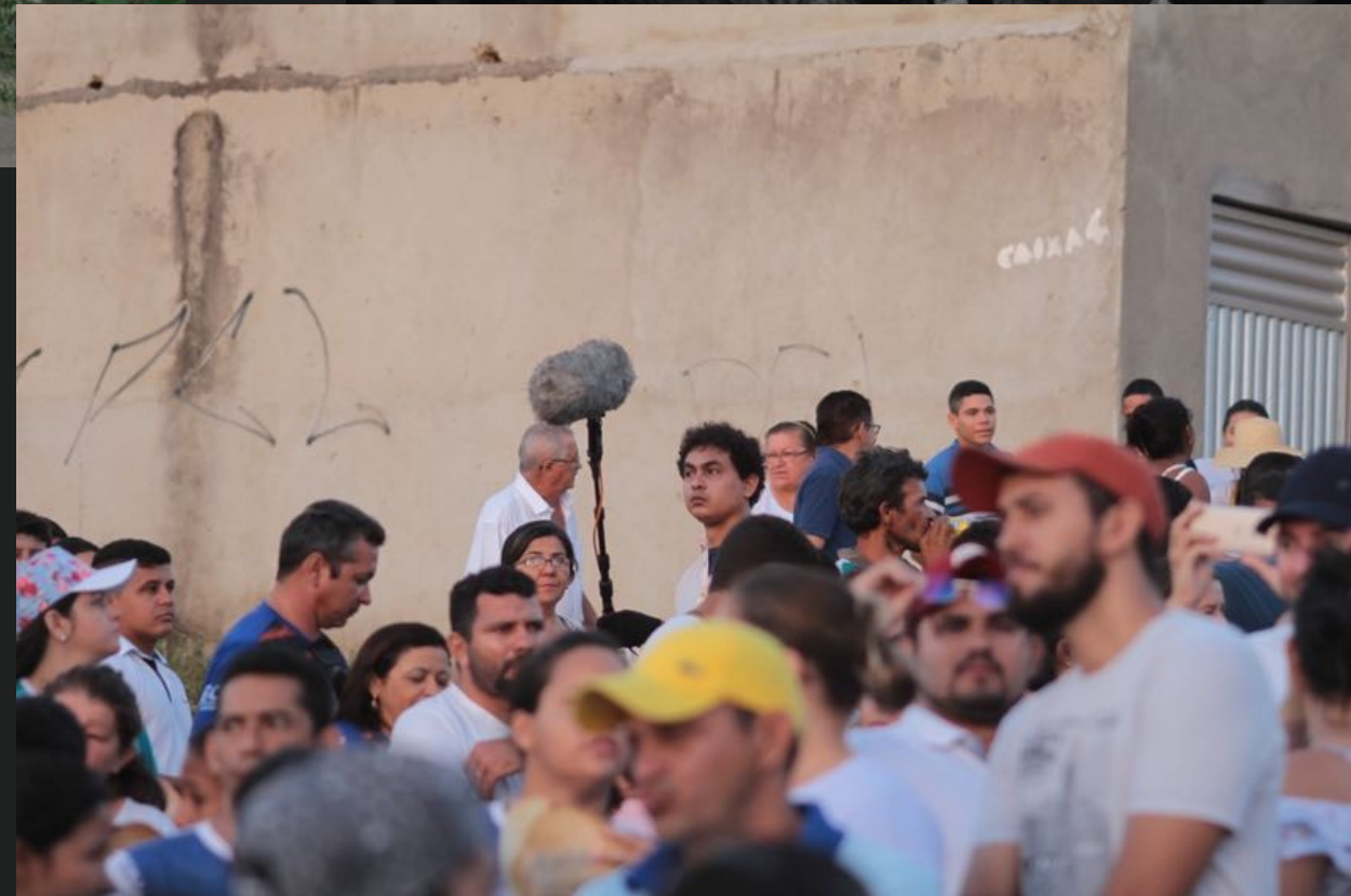
FILME CURRAIS Foto do Set de filmagem e equipe.