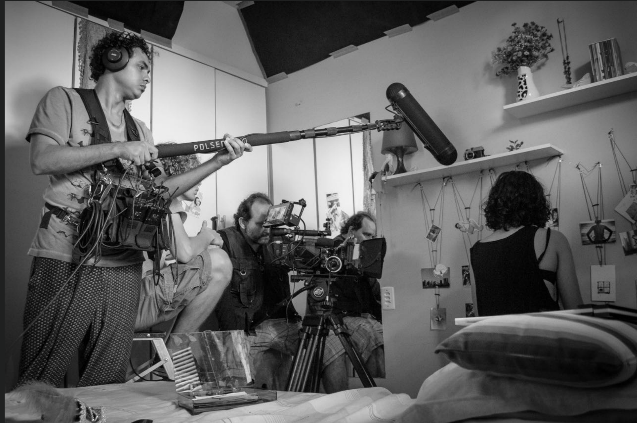
FILME QUARTA DE CINZAS Foto do Set de filmagem.