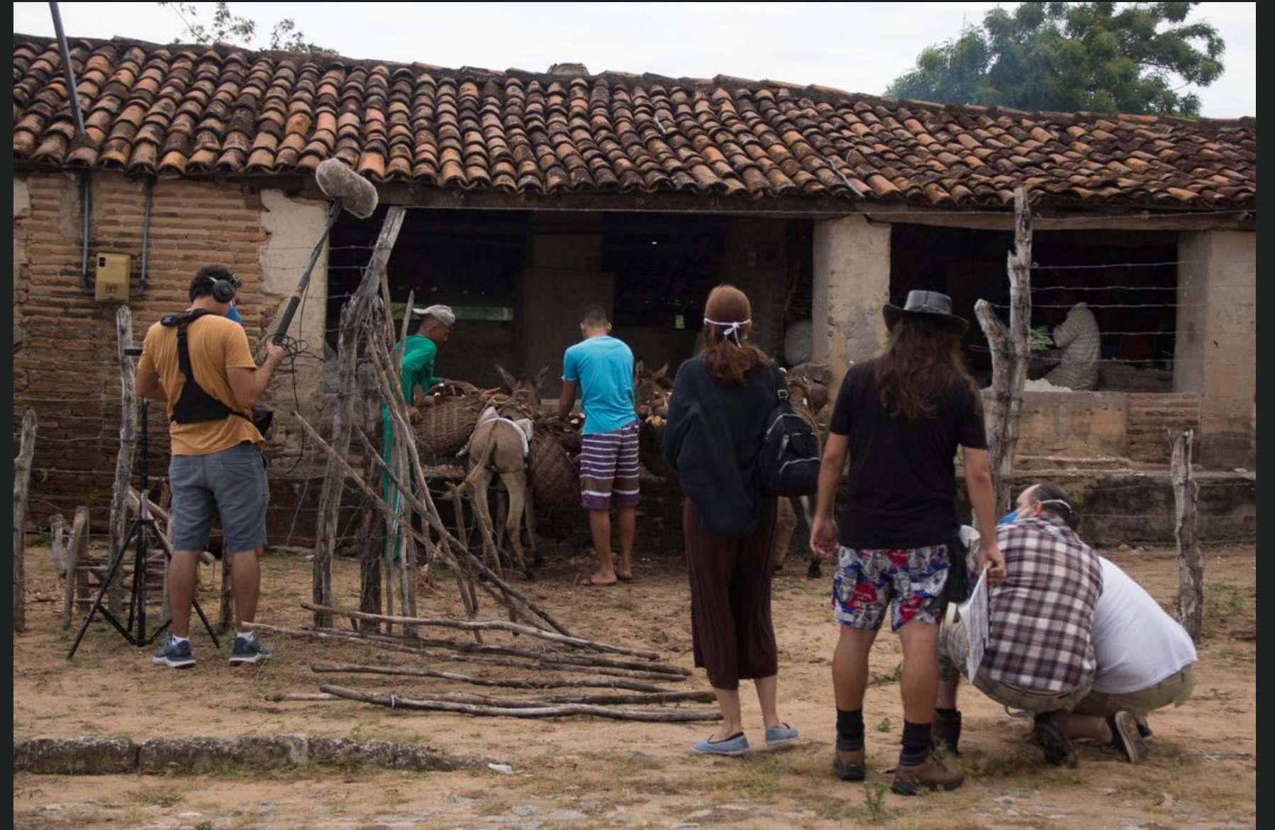
FILME ROSA NEGRA Foto do Set de filmagem.