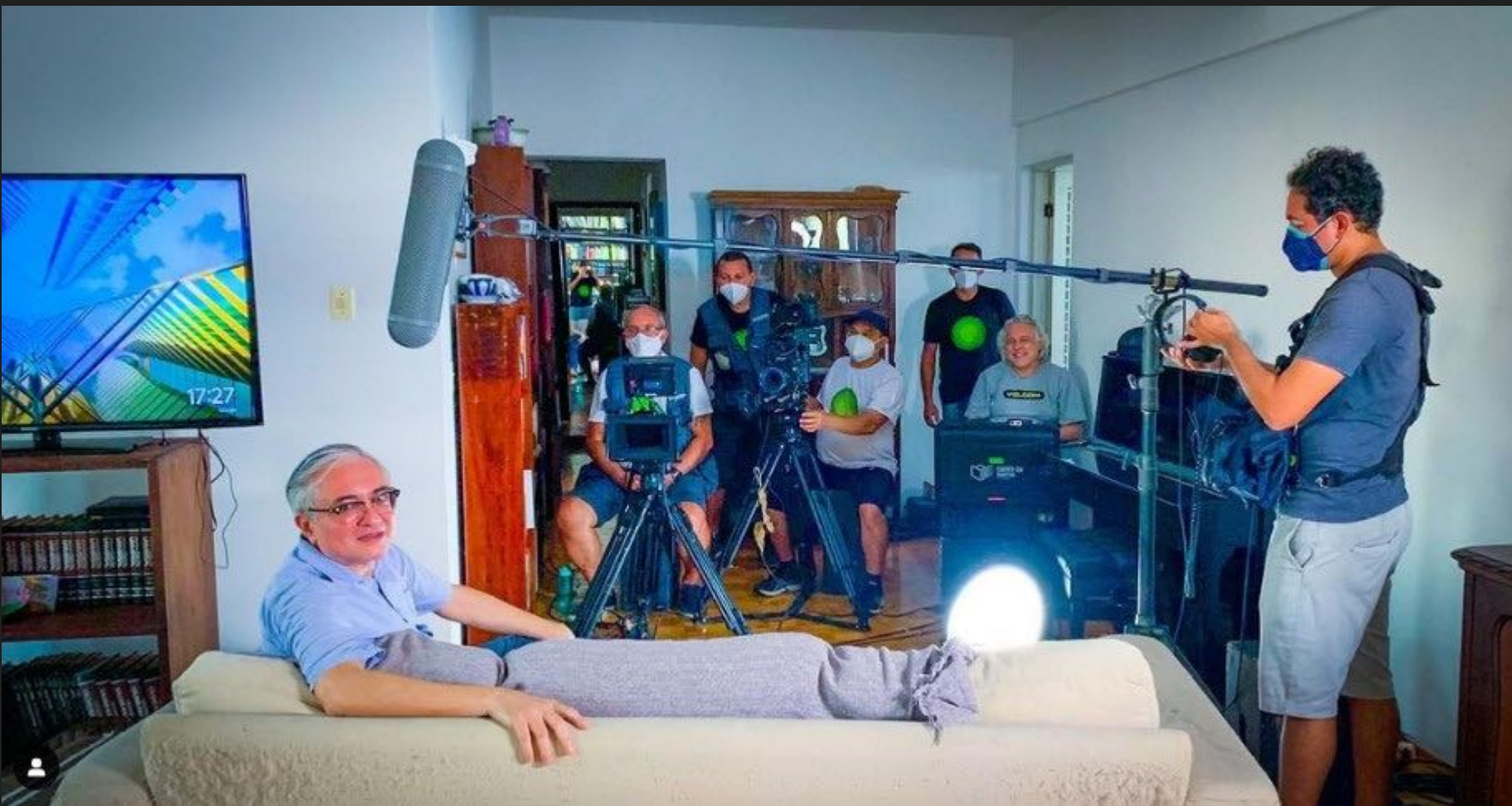
FILME ESCURIDÃO NA TERRA DA LUZ. Foto do Set de filmagem.