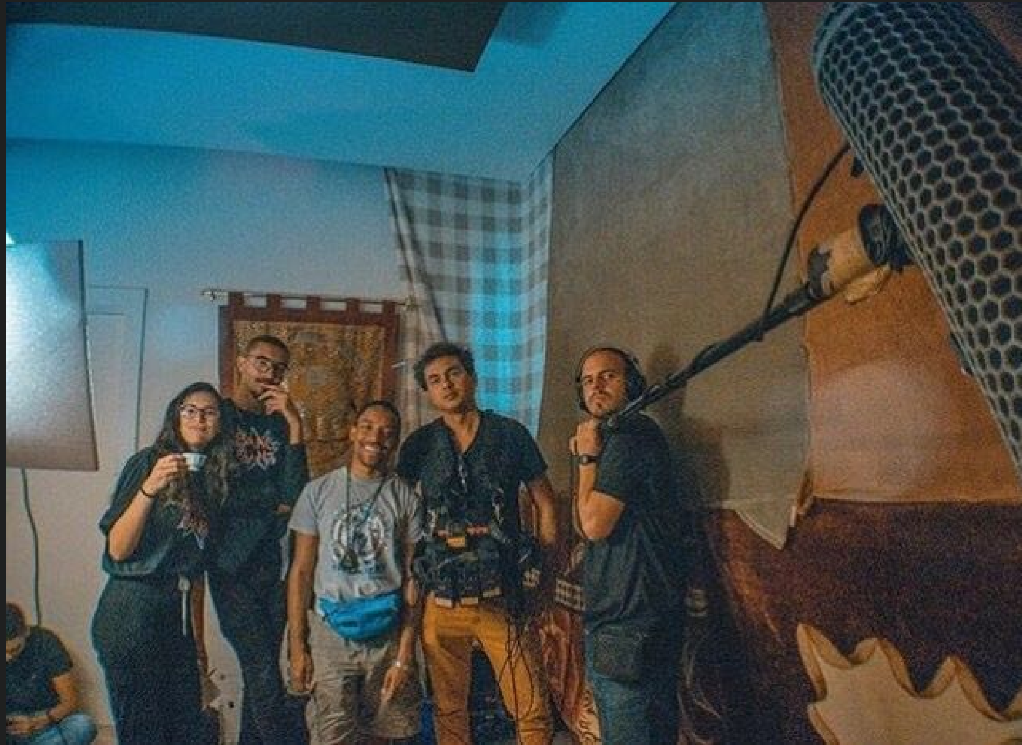
FILME BANG BANG! Foto do Set de filmagem e equipe.