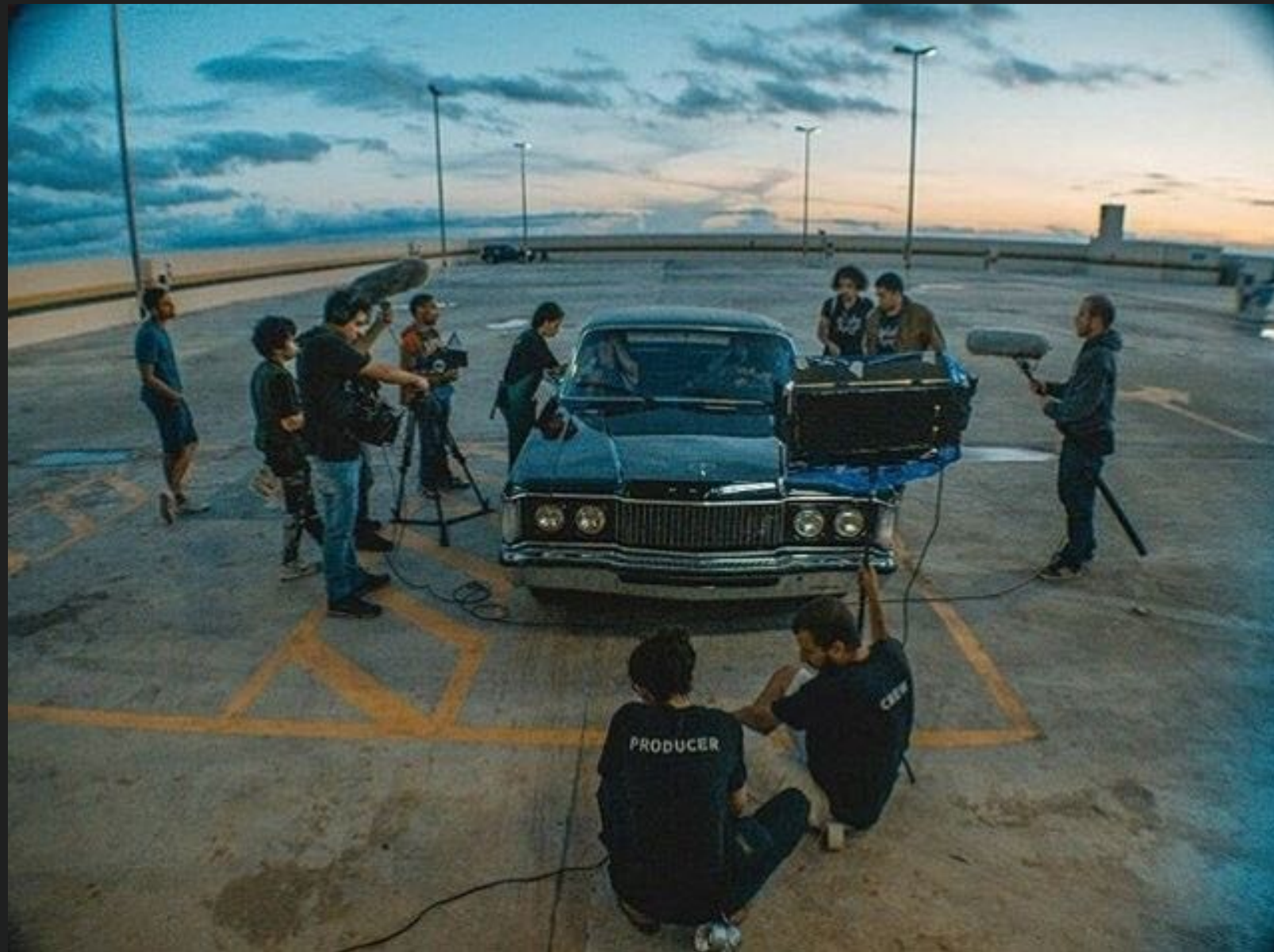
Filme de conclusão do curso da New York Film Academy. Filme exibido em sala de cinema comercial em UEA e Canada by IMDB.