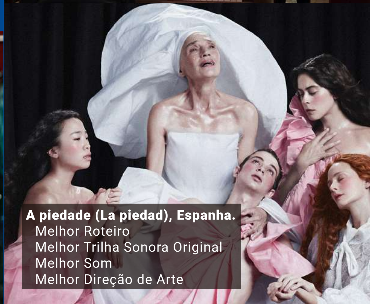
A piedade (La piedad), Espanha. Melhor Roteiro Melhor Trilha Sonora Original Melhor Som Melhor Direção de Arte