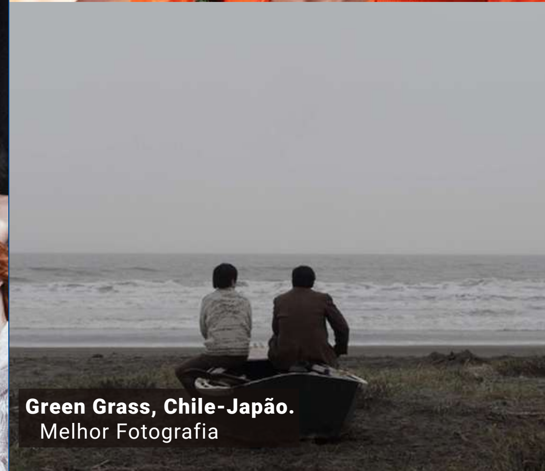
Green Grass, Chile-Japão. Melhor Fotografia