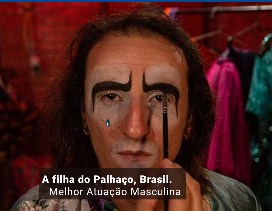
A filha do Palhaço, Brasil. Melhor Atuação Masculina

Mostra Competitiva Ibero-americana de longa-metragem