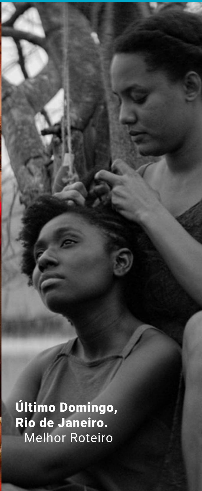
Último Domingo, Rio de Janeiro. Melhor Roteiro