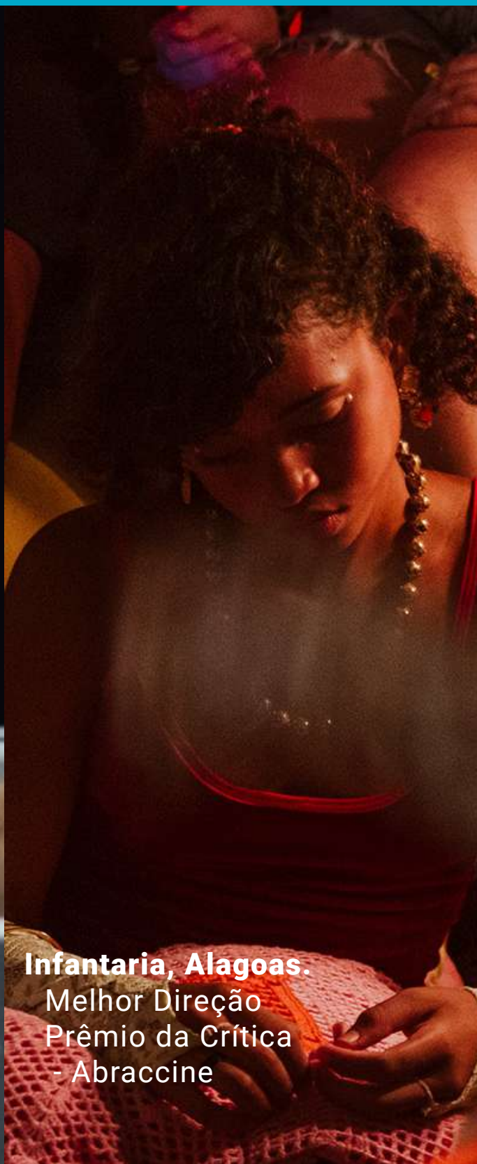
Infantaria, Alagoas. Melhor Direção Prêmio da Crítica - Abraccine