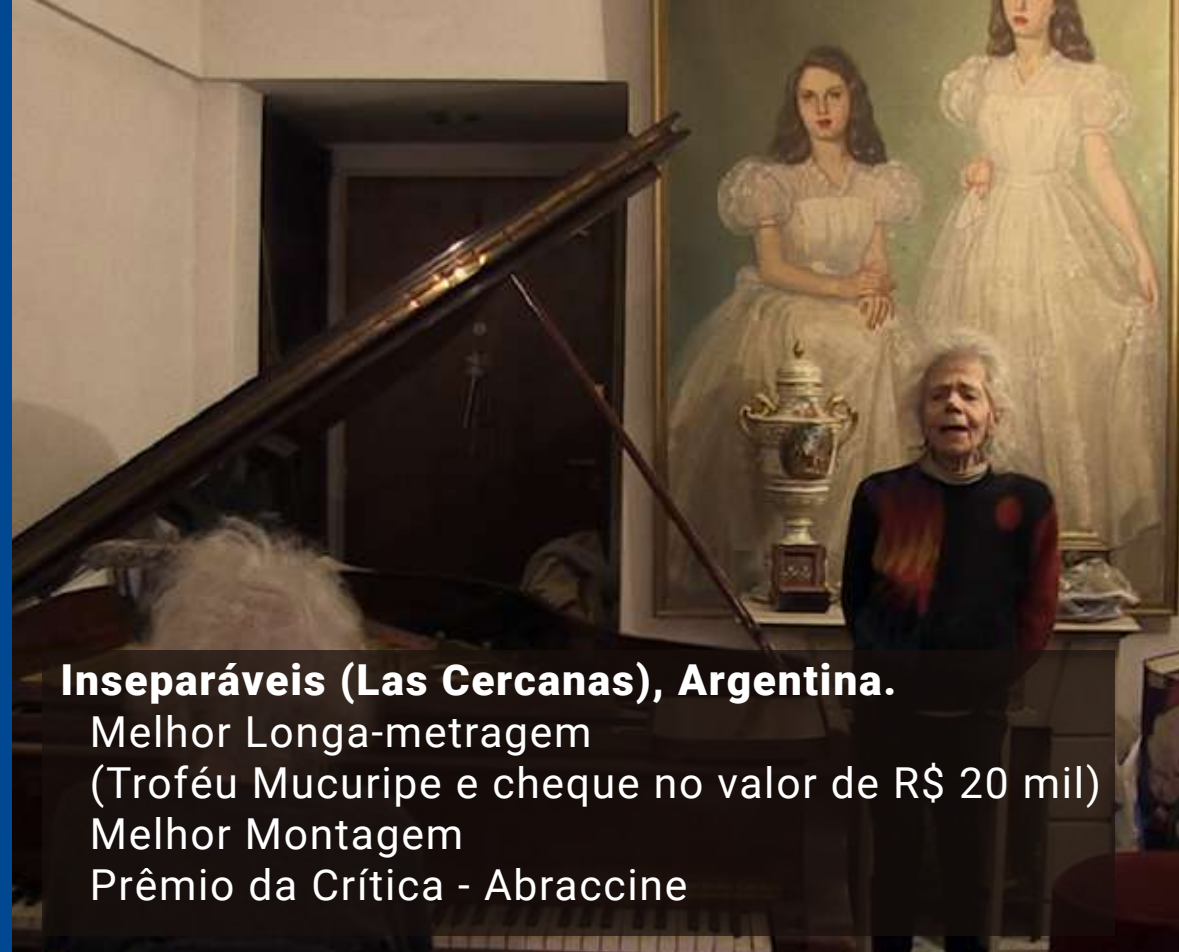
Inseparáveis (Las Cercanas), Argentina. Melhor Longa-metragem (Troféu Mucuripe e cheque no valor de R$ 20 mil) Melhor Montagem Prêmio da Crítica - Abraccine