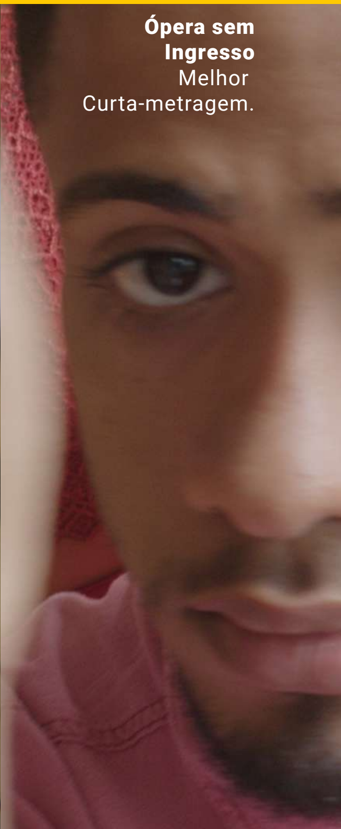
Ópera sem Ingresso Melhor Curta-metragem.