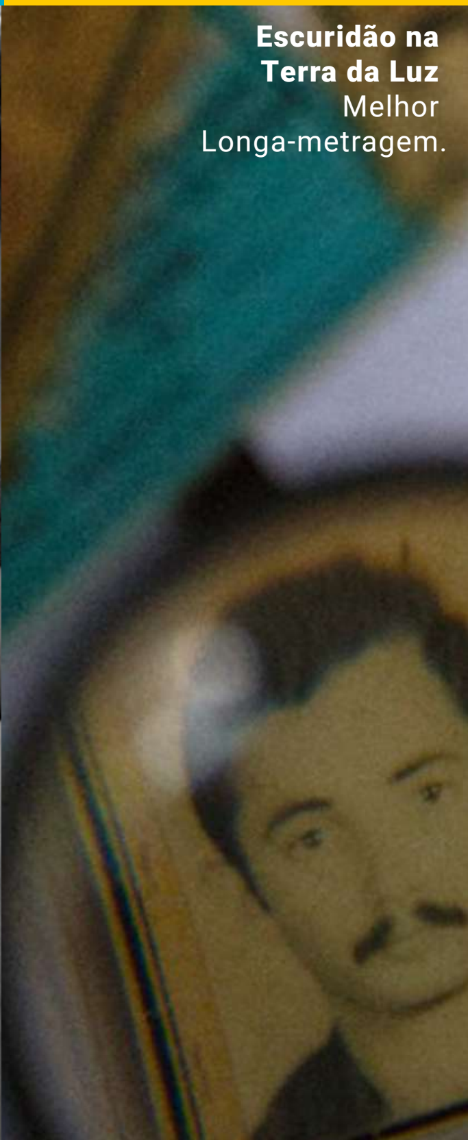
Escuridão na Terra da Luz Melhor Longa-metragem.